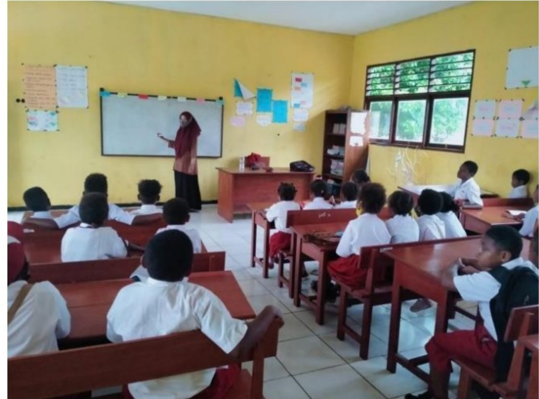
Proses pembelajaran di SD YPK 20 Guweintuy