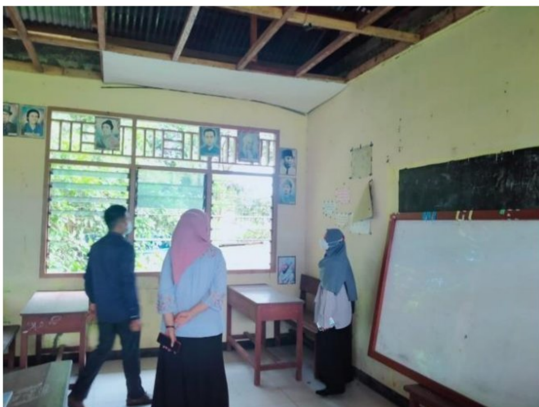
Pengenalan beberapa ruangan di lingkungan SD YPK 20 Guweintuy