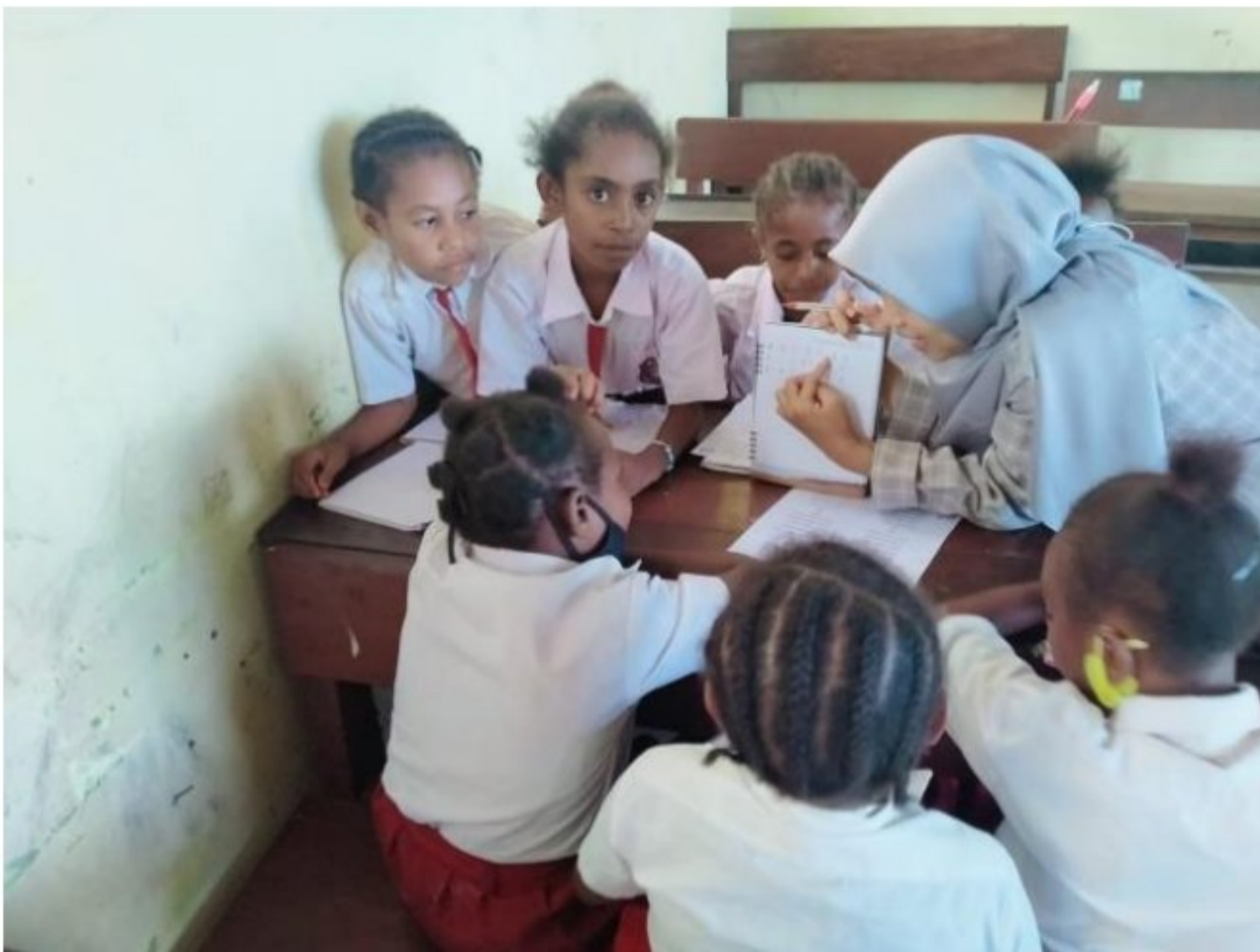
pendampingan pembelajaran di SD YPK 20 Guweintuy