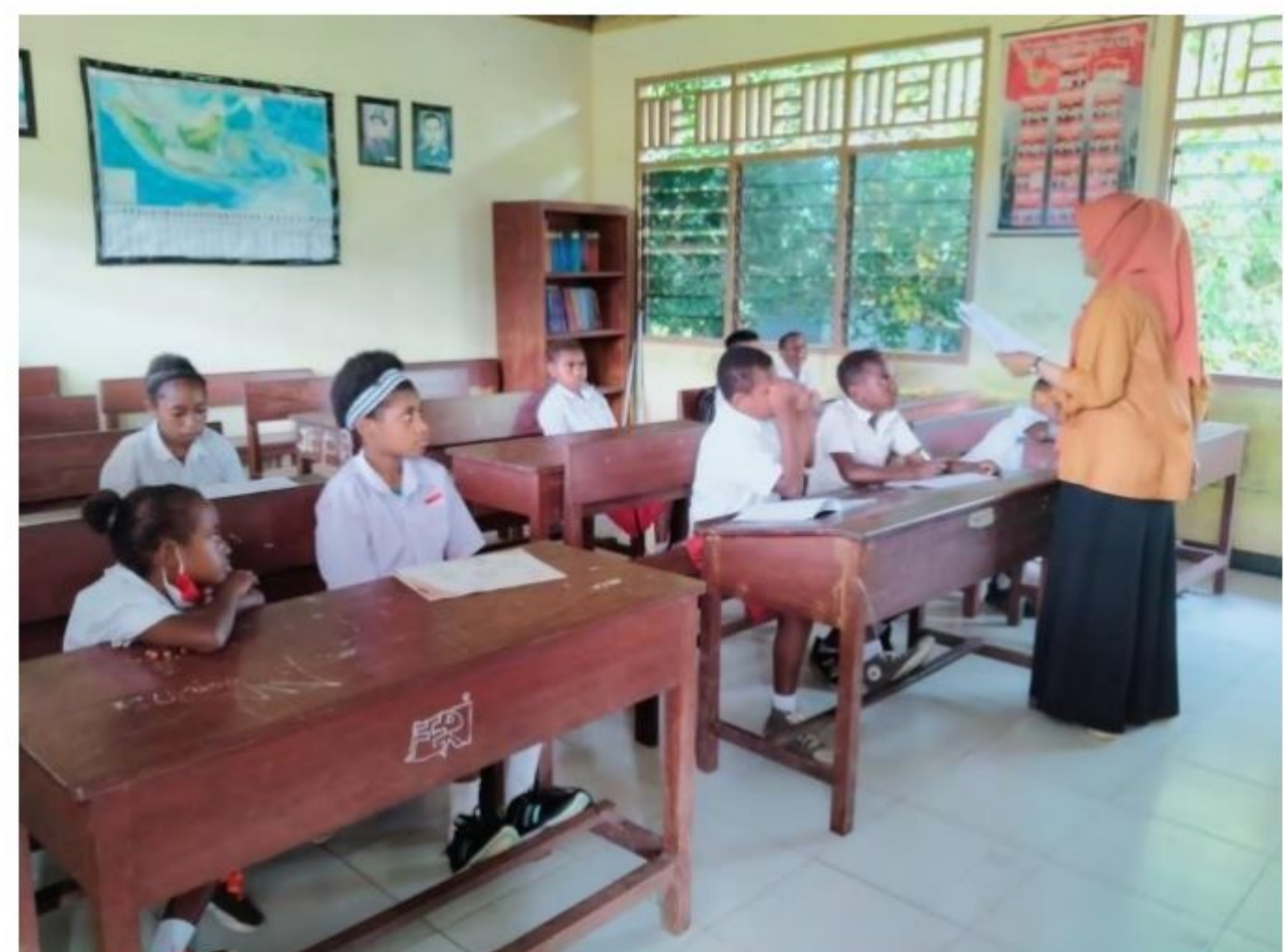
Proses pembelajaran peserta didik SD YPK 20 Guweintuy