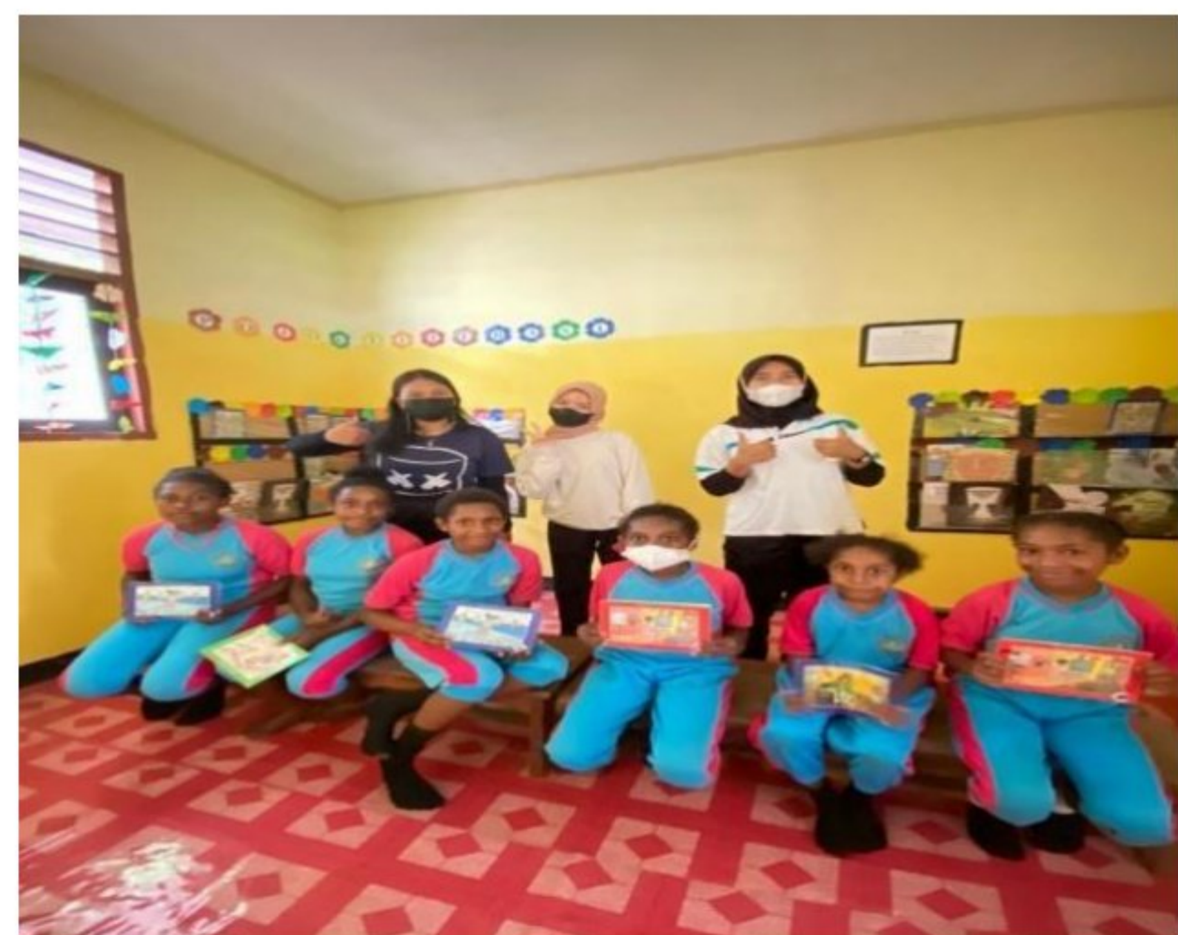
Literasi dan numerasi di perpustakaan SD YPK 20 Guweintuy