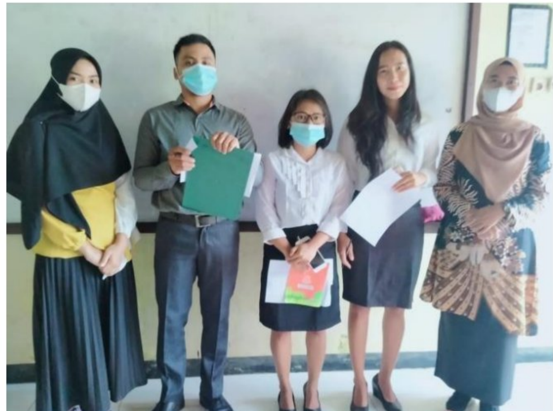
Foto bersama dengan tim penilai kebersihan SD YPK 20 Guweintuy