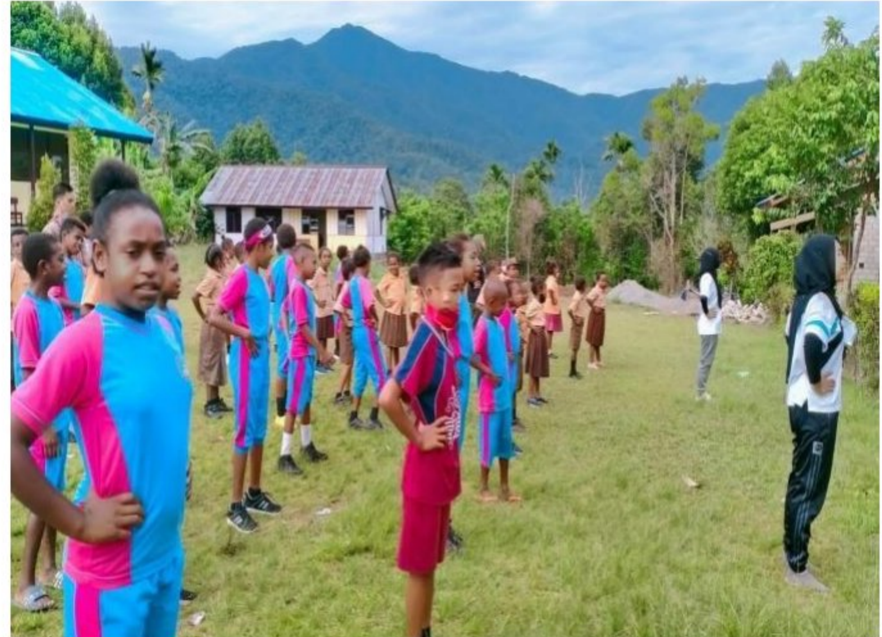
Kegiatan senam bersama di SD YPK 20 Guweintuy