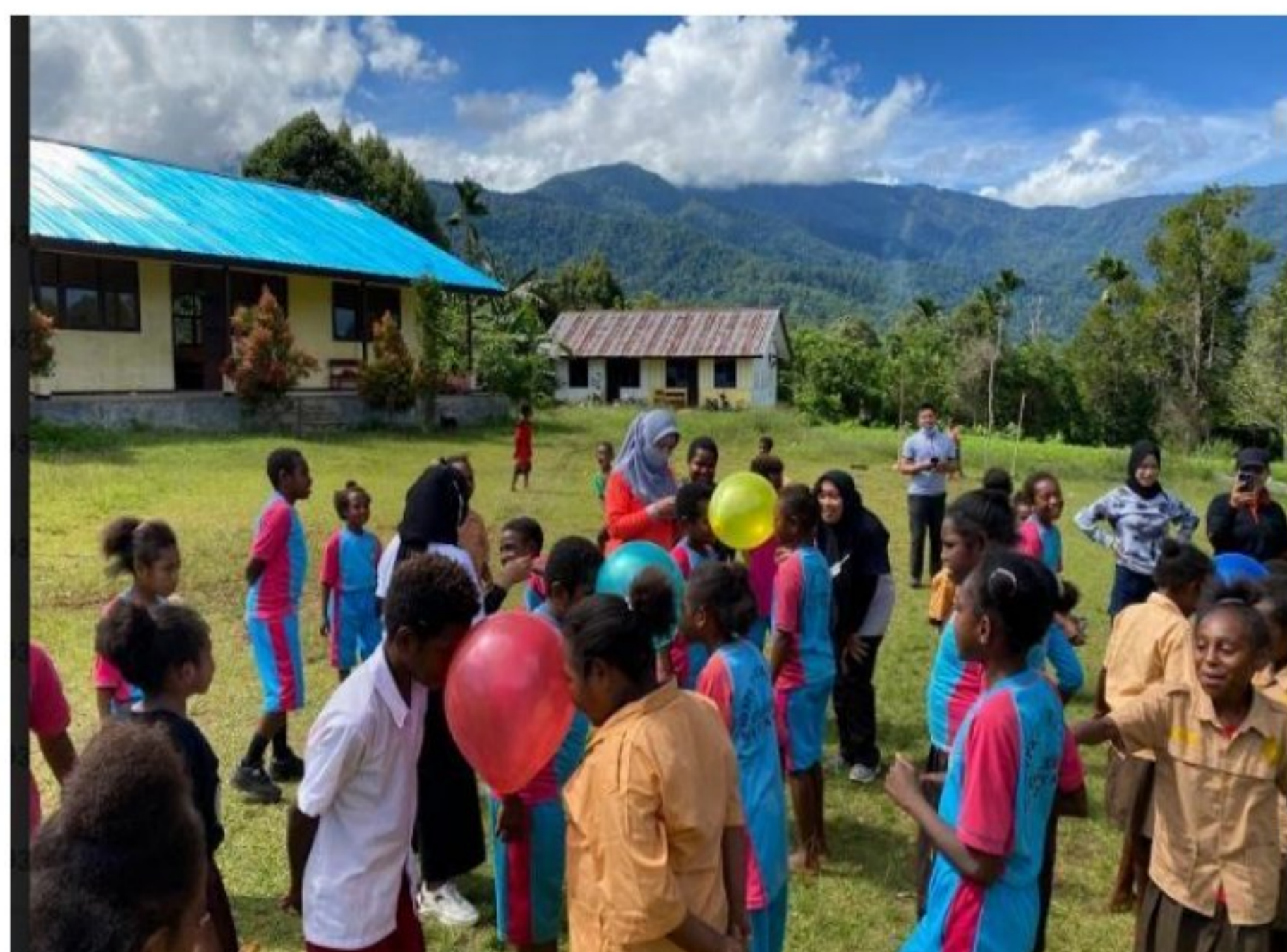
Kegiatan lomba tradisional di akhir semester ganjil SD YPK 20 Guweintuy