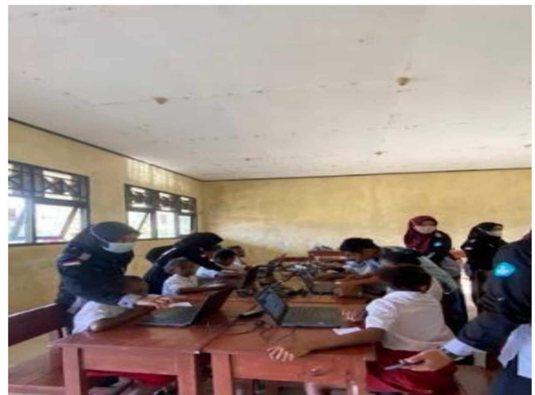
Kegiatan ANBK bersama dengan peserta didik dan tenaga pendidik SD YPK 20 Guwintuy