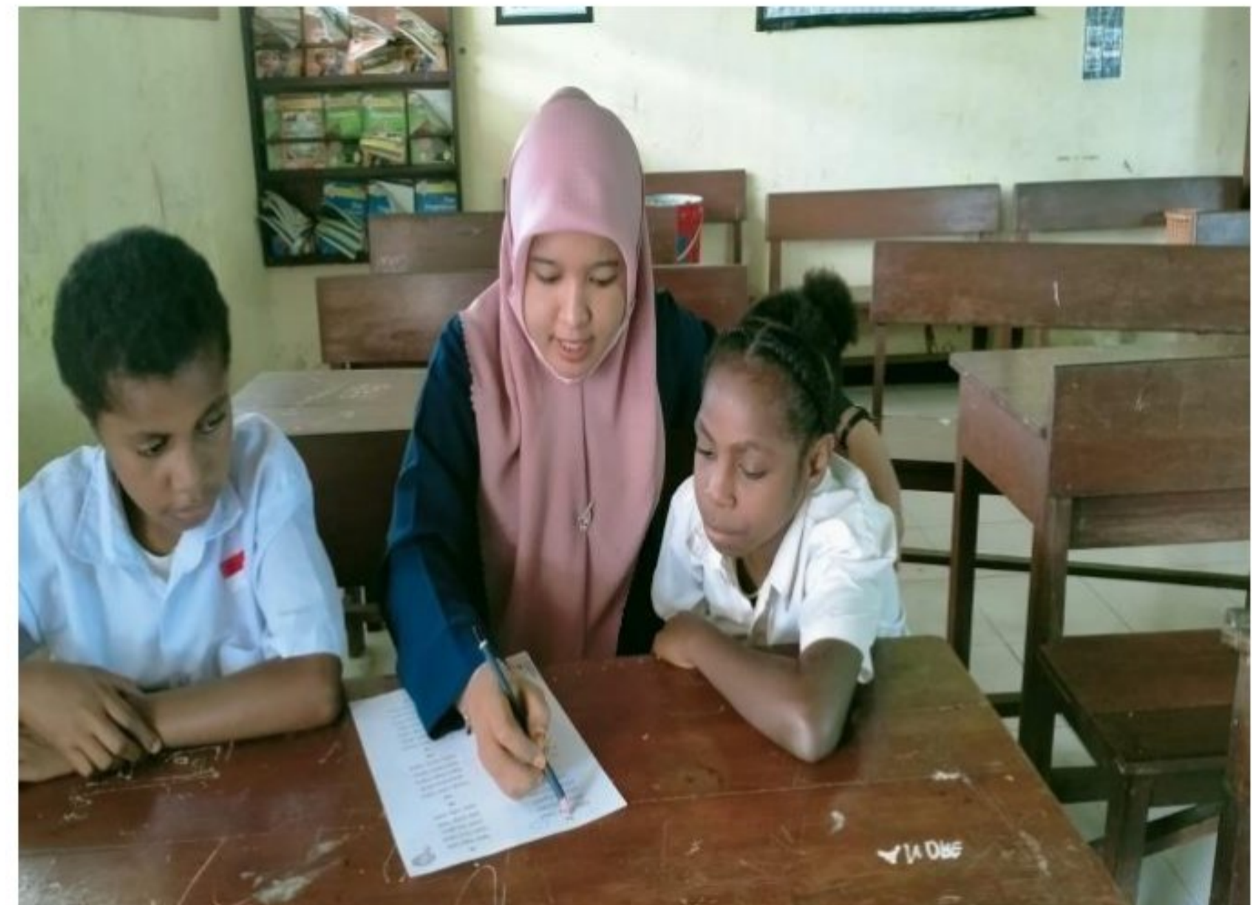
Penampingan pembelajaran peserta didik SD YPK 20 Guweintuy