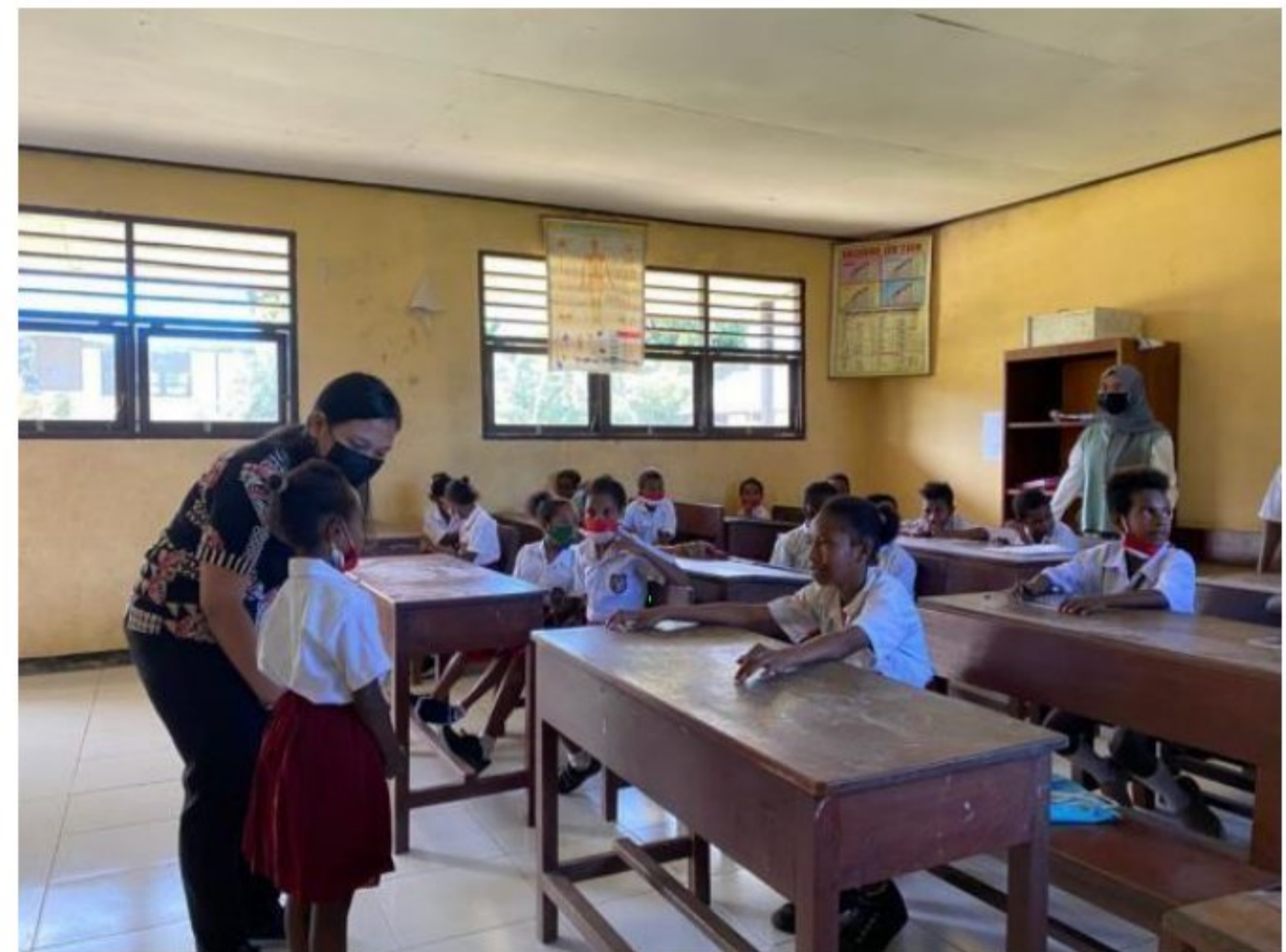
Pengenalan dengan peserta didik SD YPK 20 Guweintuy