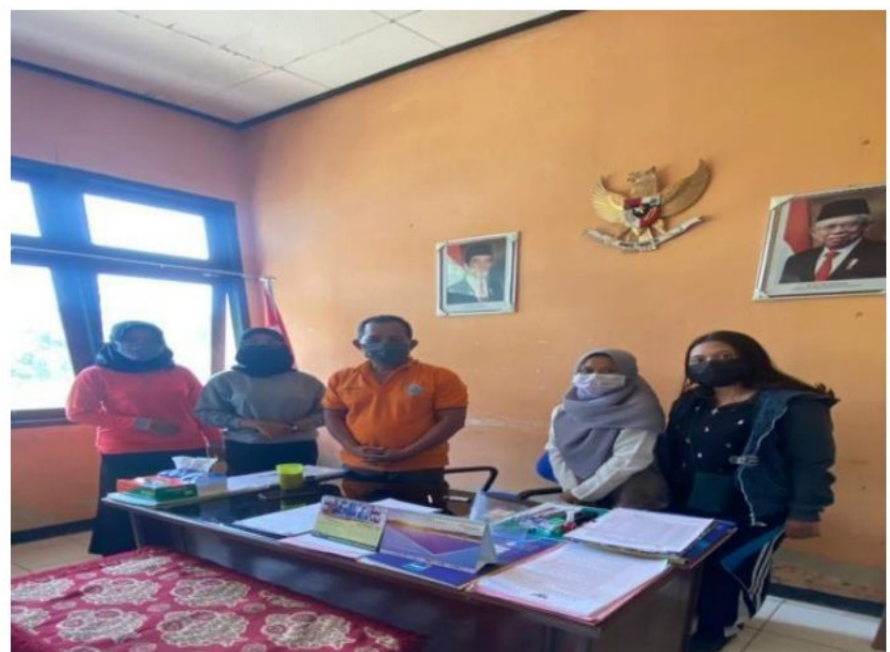
Kunjungan ke pemerintahan kecamatan warmare tentang kondisi SD YPK 20 Guweintuy