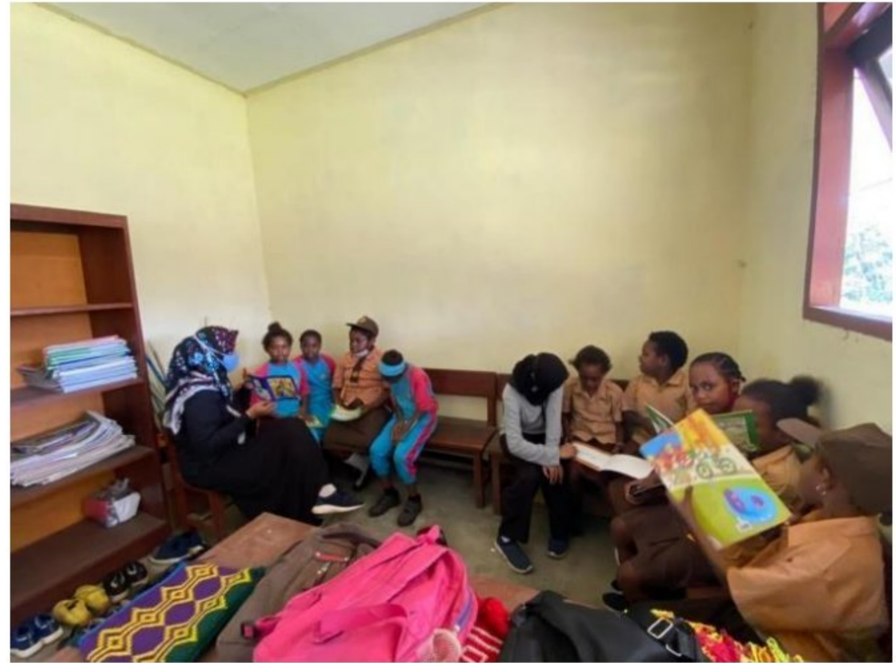
Penerapan literasi dan numerasi kepada peserta didik di lingkungan perpustakaan mini