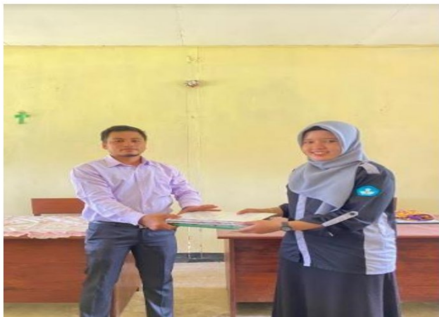
Penyerahan bantuan administrasi SD YPK 20 Guweintuy