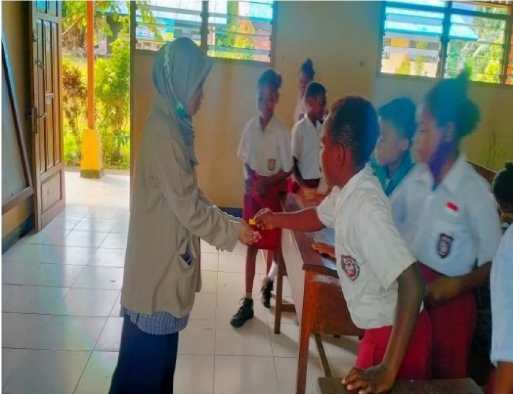
Pengajaran tentang pemilihan ketua kelas kepada peserta didik