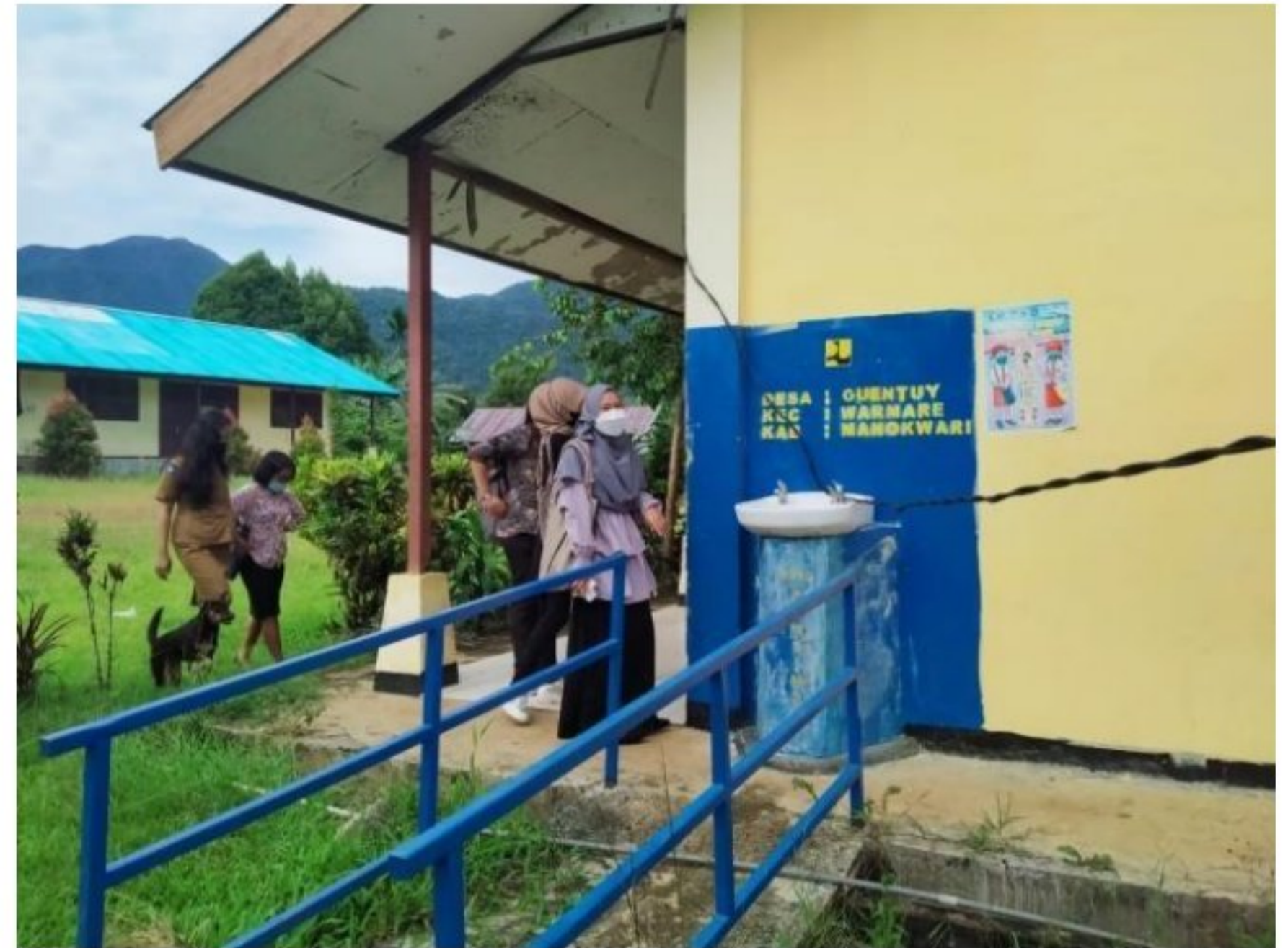
Pengenalan beberapa ruangan di lingkungan SD YPK 20 Guweintuy