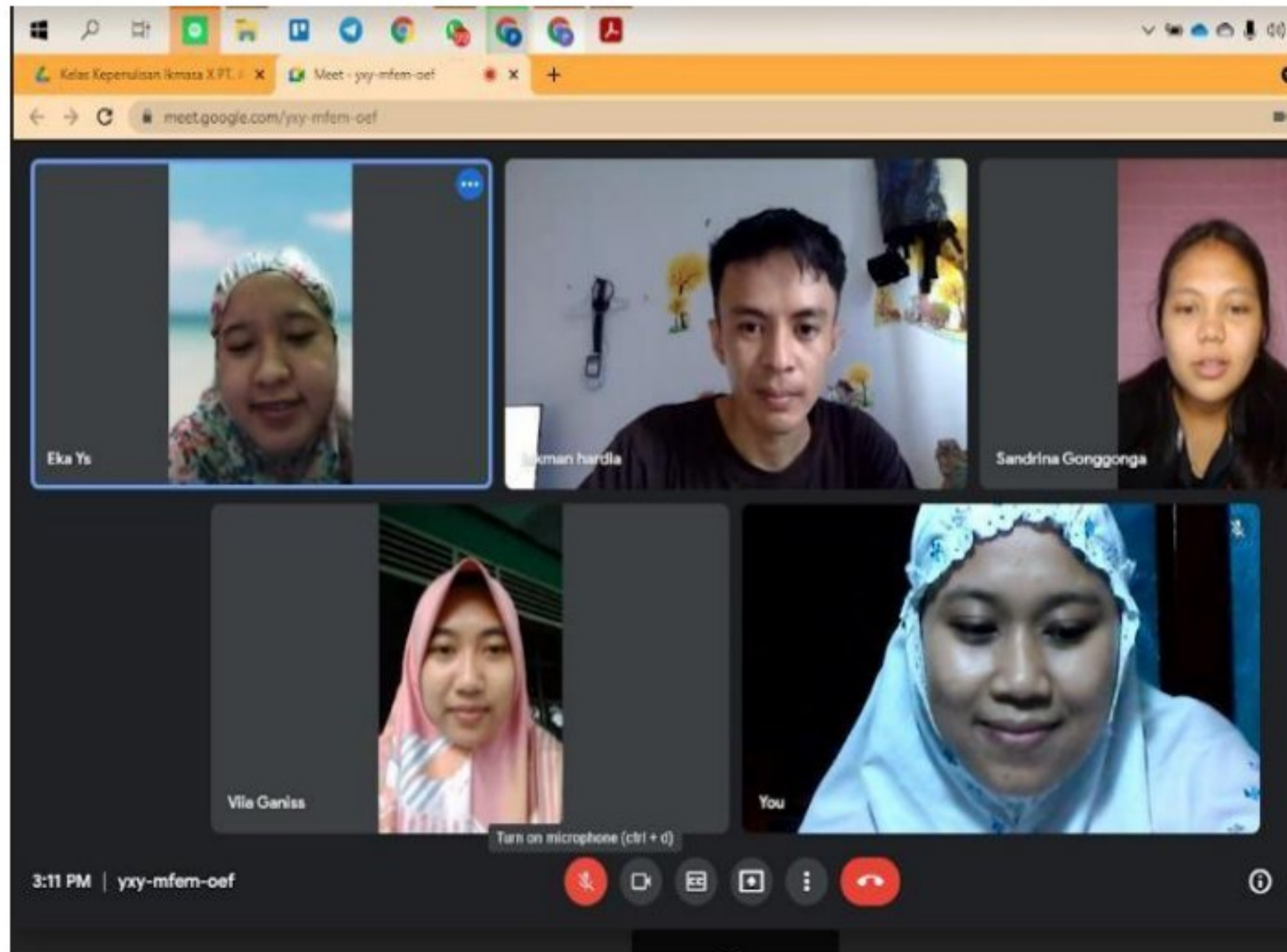
Diskusi virtual bersama dengan Dosen pembimbing Lapangan dan tim KM 2