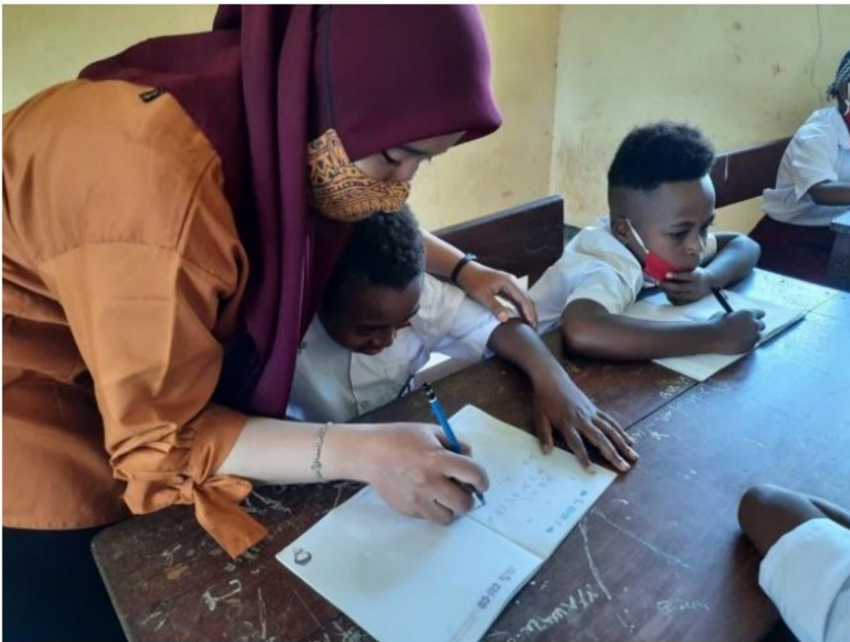
Penampungan pembelajaran peserta didik SD YPK 20 Guweintuy