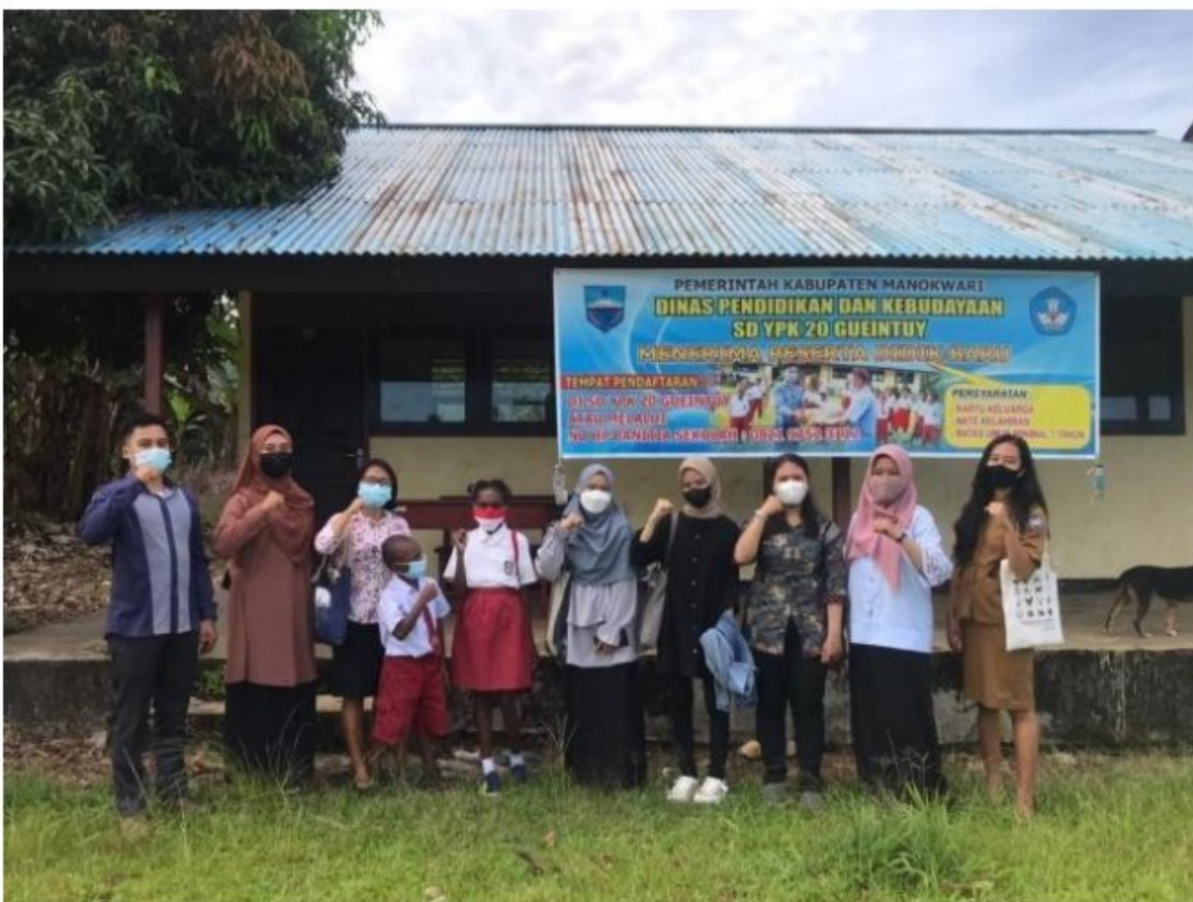
Foto Perdana mahasiswa KM2 dengan guru dan salah satu peserta didik SD YPK 20 Guweintuy