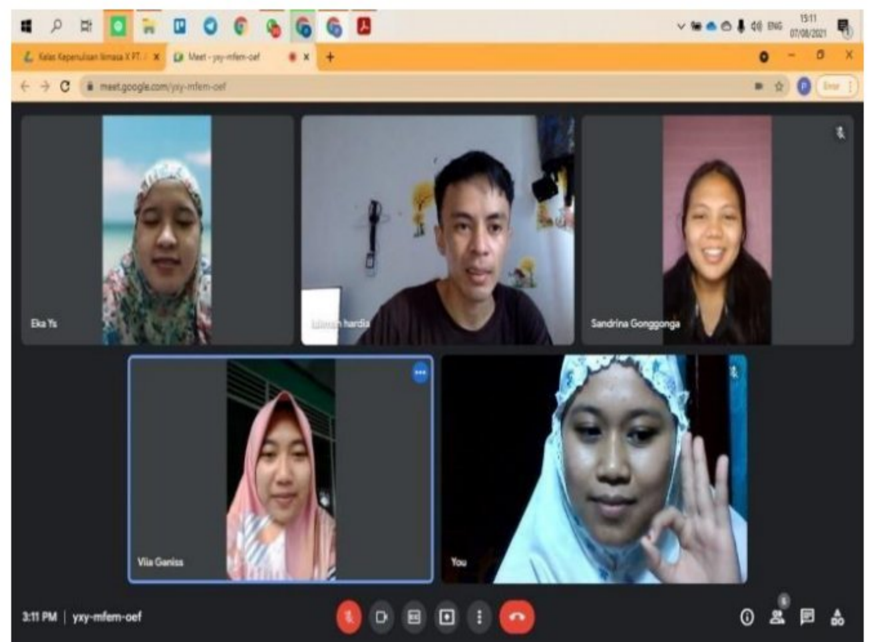
Diskusi bersama DPL tentang pengenalan lingkungan SD YPK 20 Guweintuy