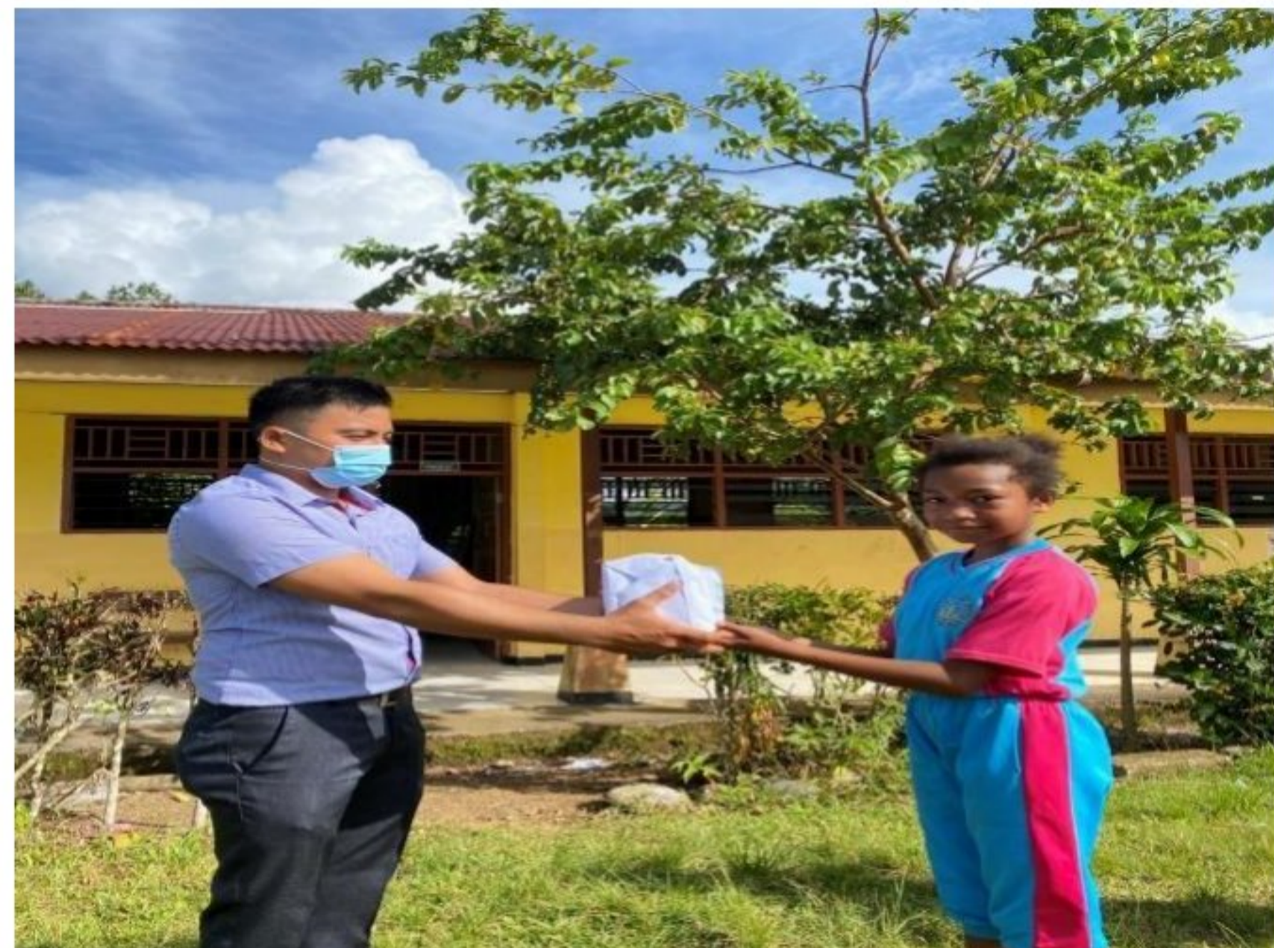
Penyerahan hadiah kepada juara kebersihan SD YPK 20 Guweintuy