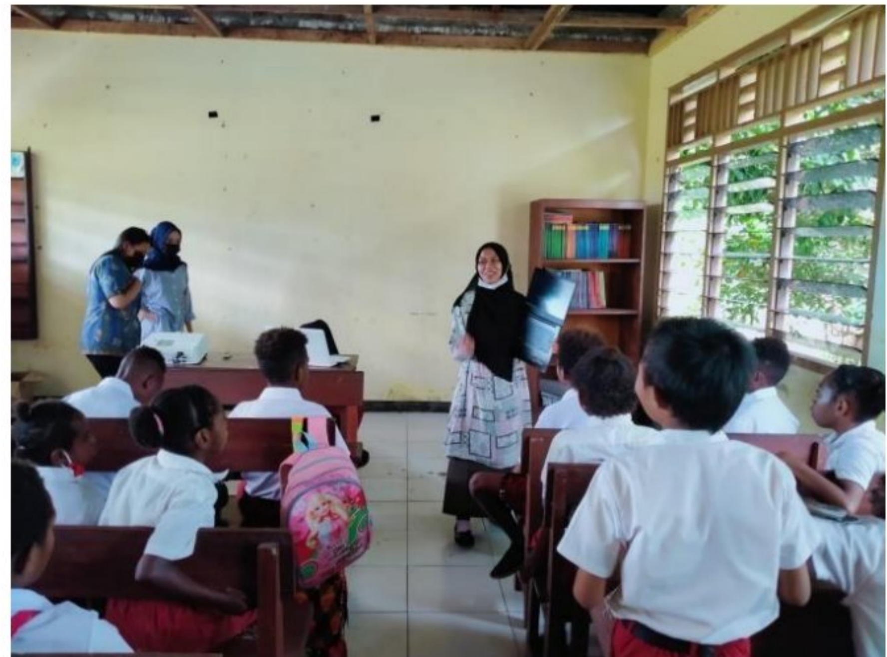
Memperkenalkan kecanggihan teknologi kepada peserta didik