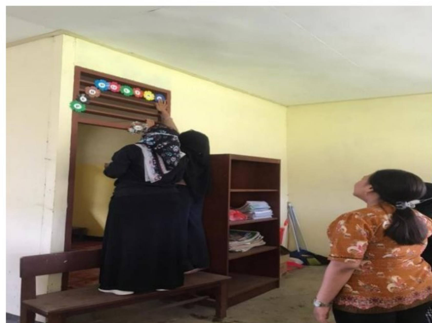
Menempelkan hiasan dinding di perpustakaan mini SD YPK 20 Guweintuy