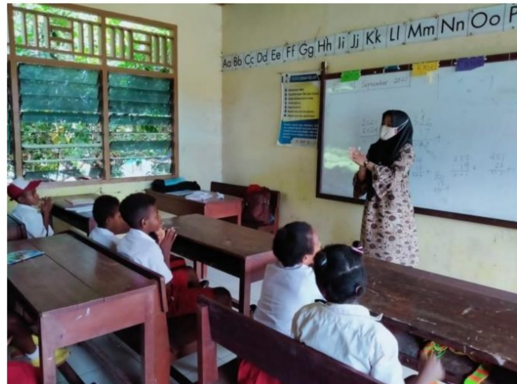
Proses pembelajaran di SD YPK 20 Guweintuy