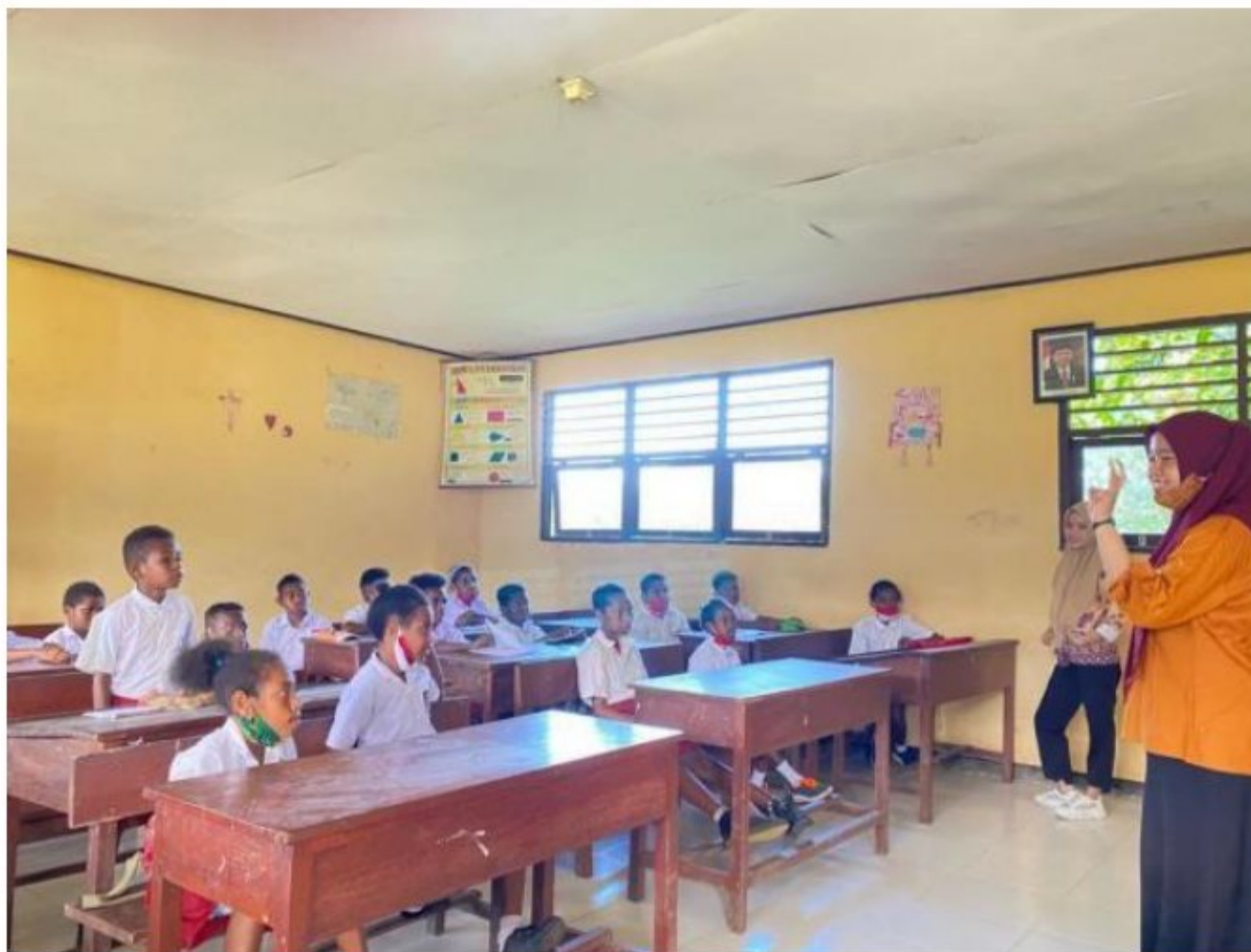
Pengenalan dengan peserta didik SD YPK 20 Guweintuy