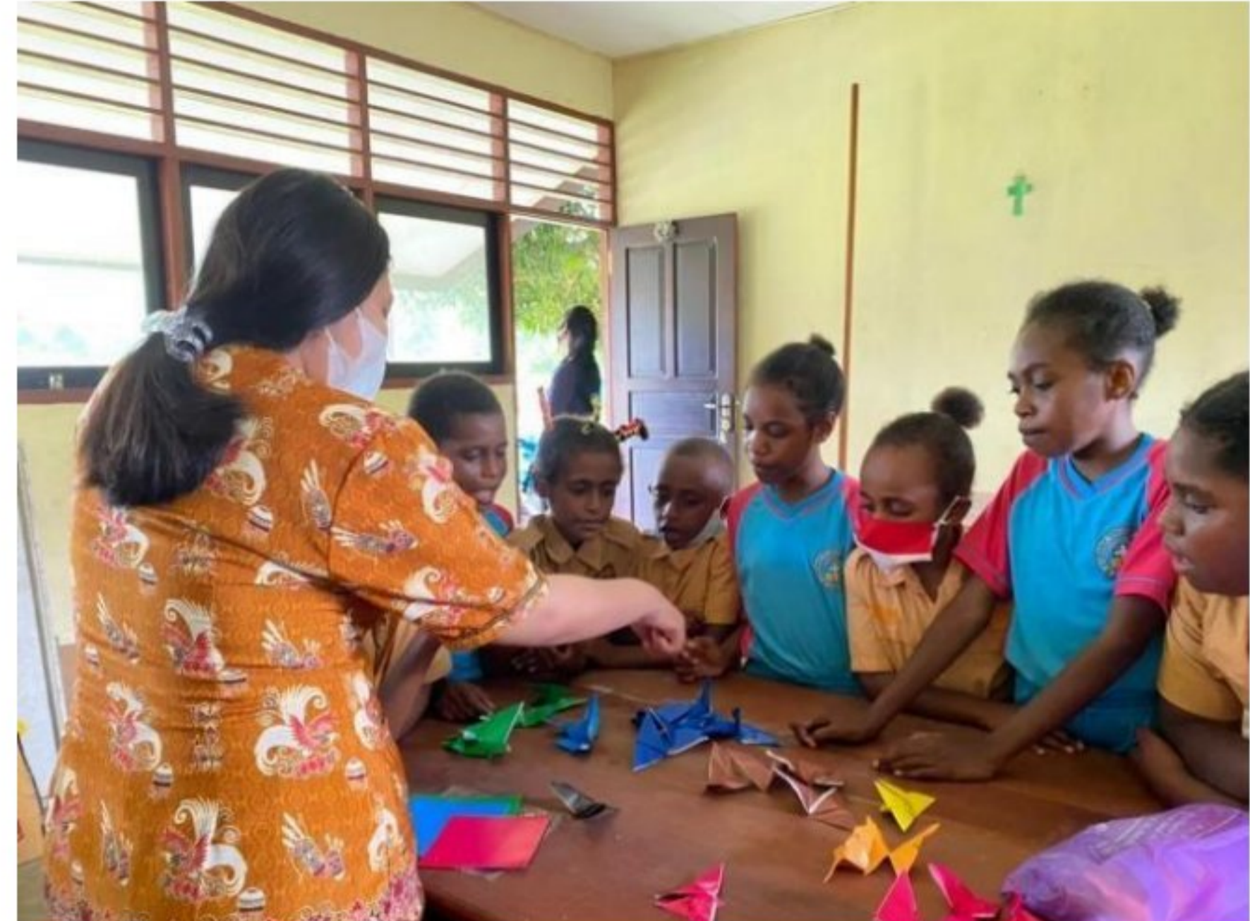
Menghias Perpustakaan Mini bersama peserta didik SD YPK 20 Guweintuy