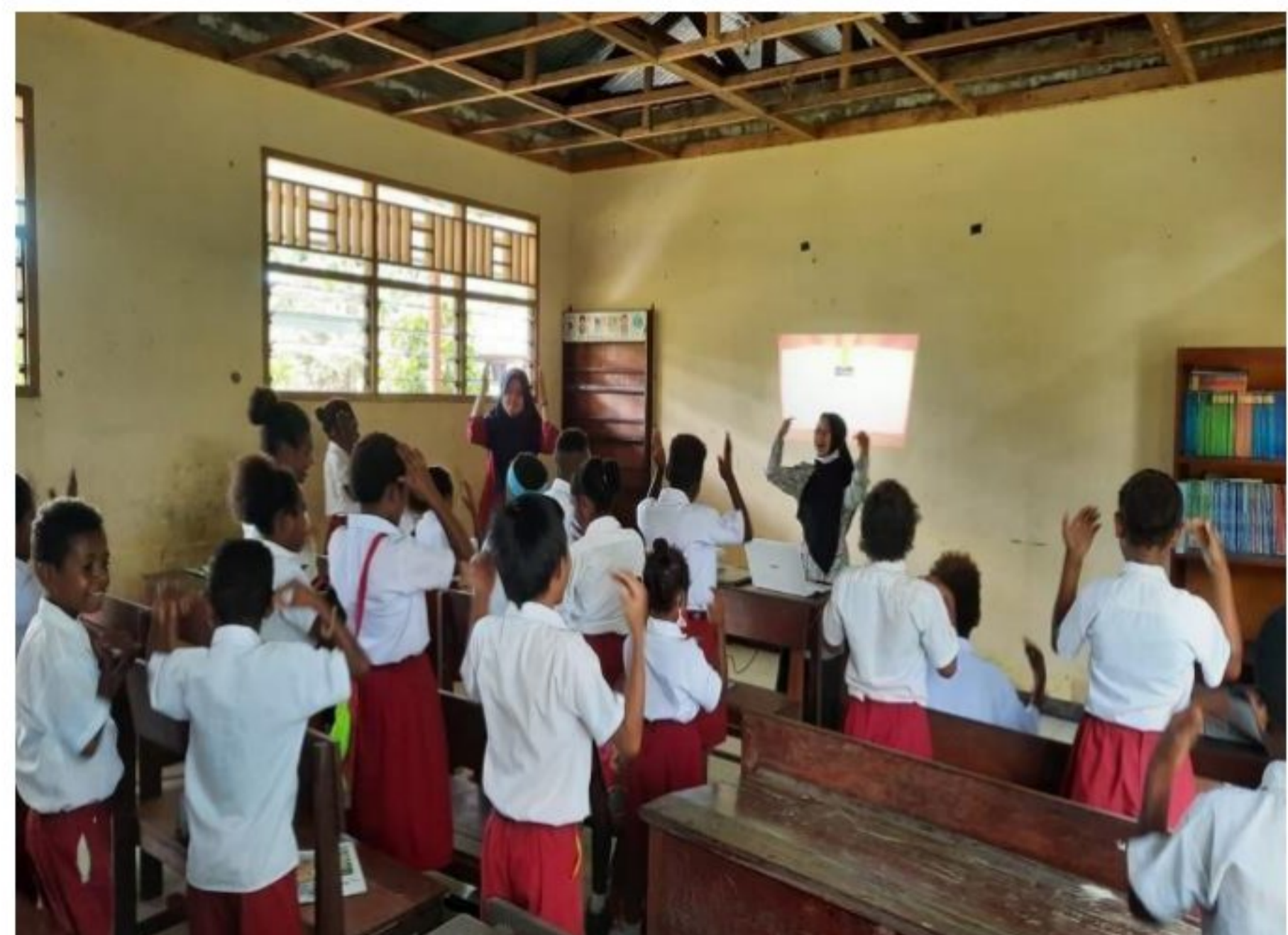
Ice breaking ditengah pembelajaran SD YPK 20 Guweintuy