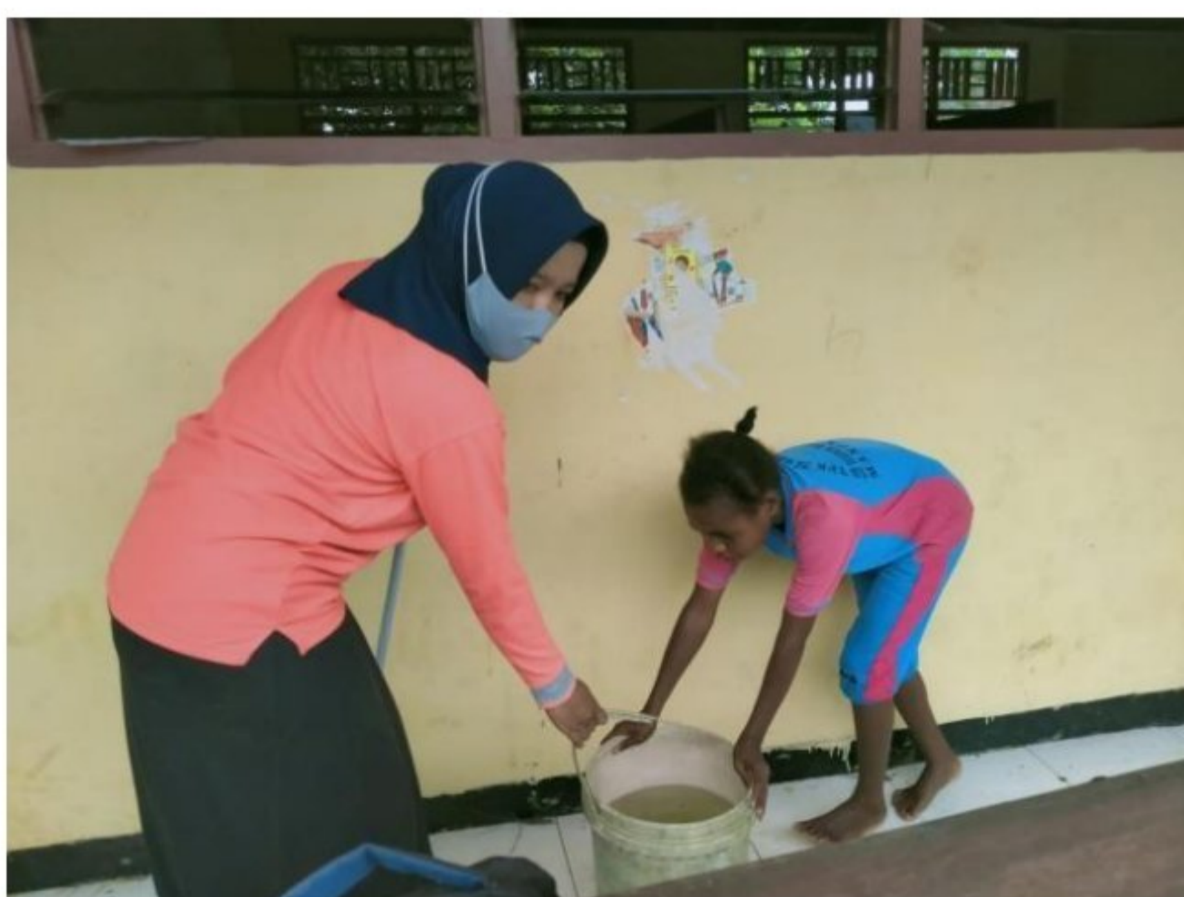
Kegiatan membersihkan di SD YPK 20 Guweintuy