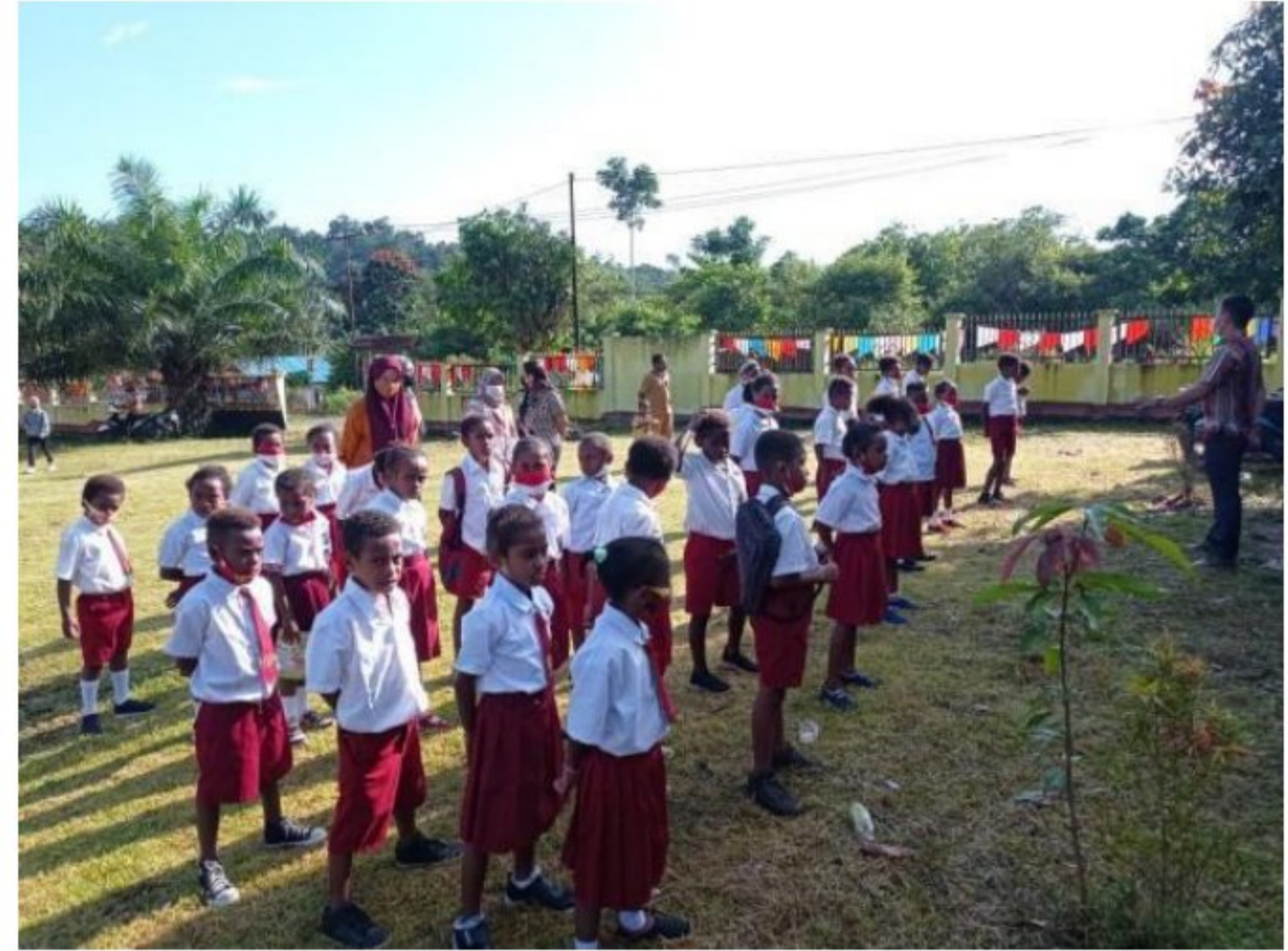
Arahan apel pagi oleh tenaga pendidik SD YPK 20 Guweintuy