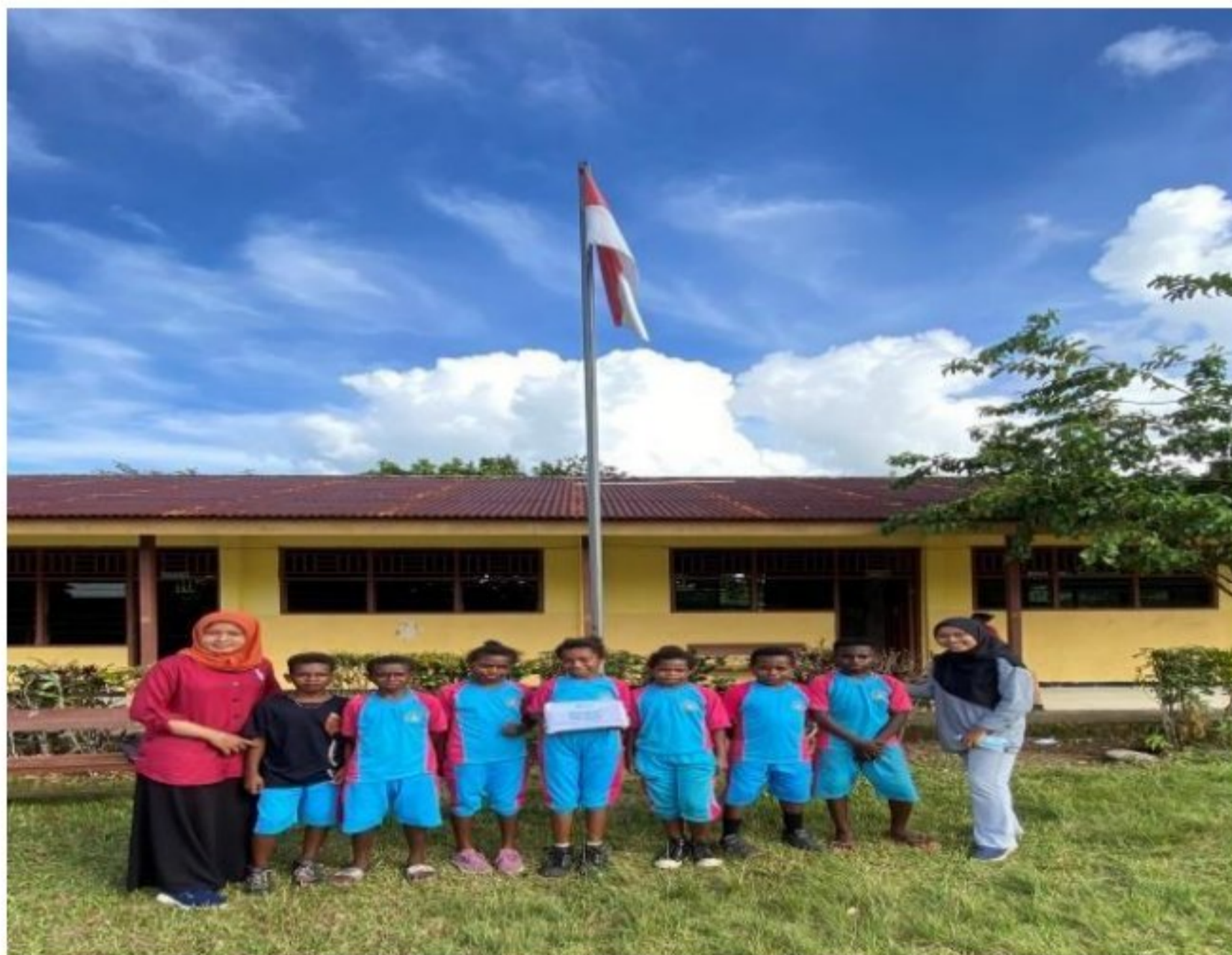
Foto bersama peserta didik sebagai juara kebersihan kelas SD YPK 20 Guweintuy