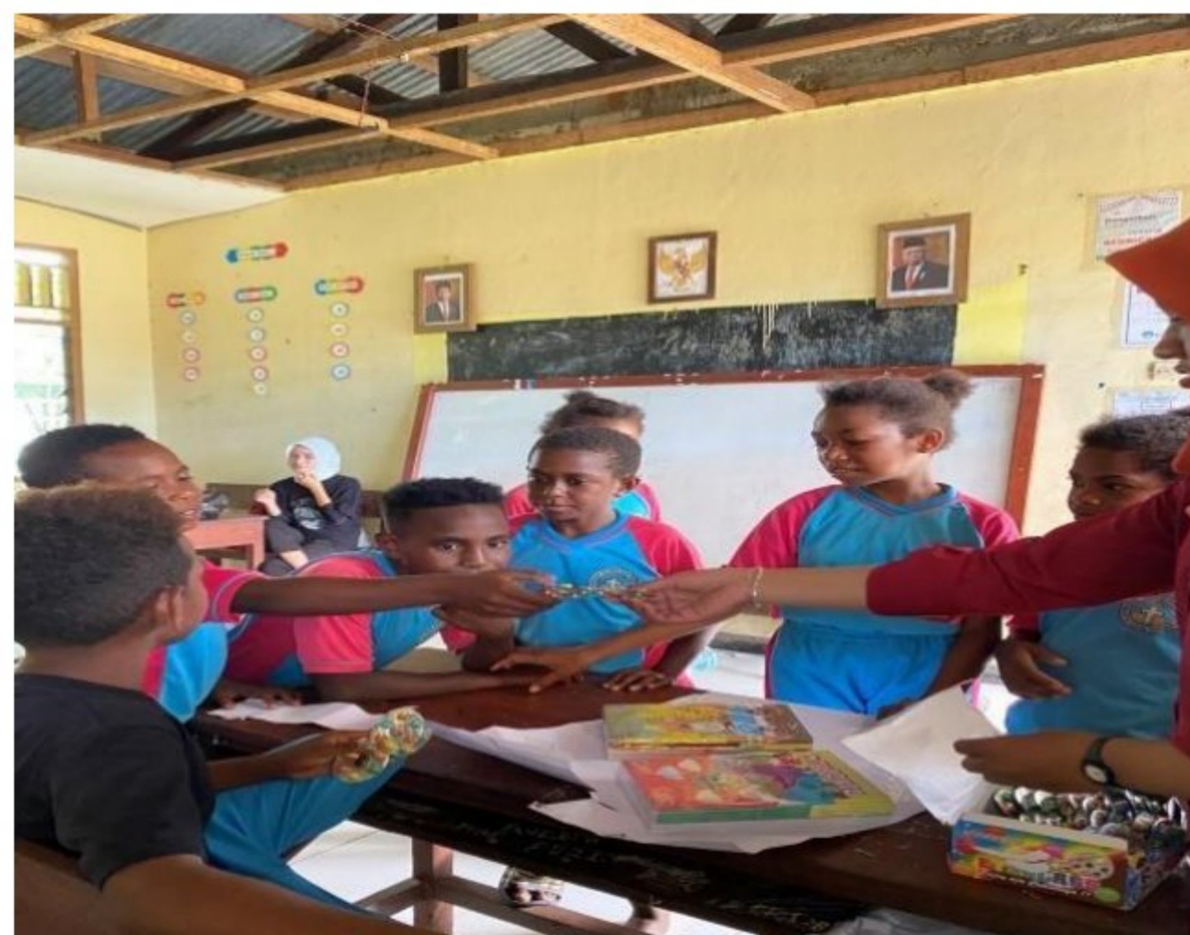
Pembagian hadiah kepada peserta didik SD YPK 20 Guweintuy