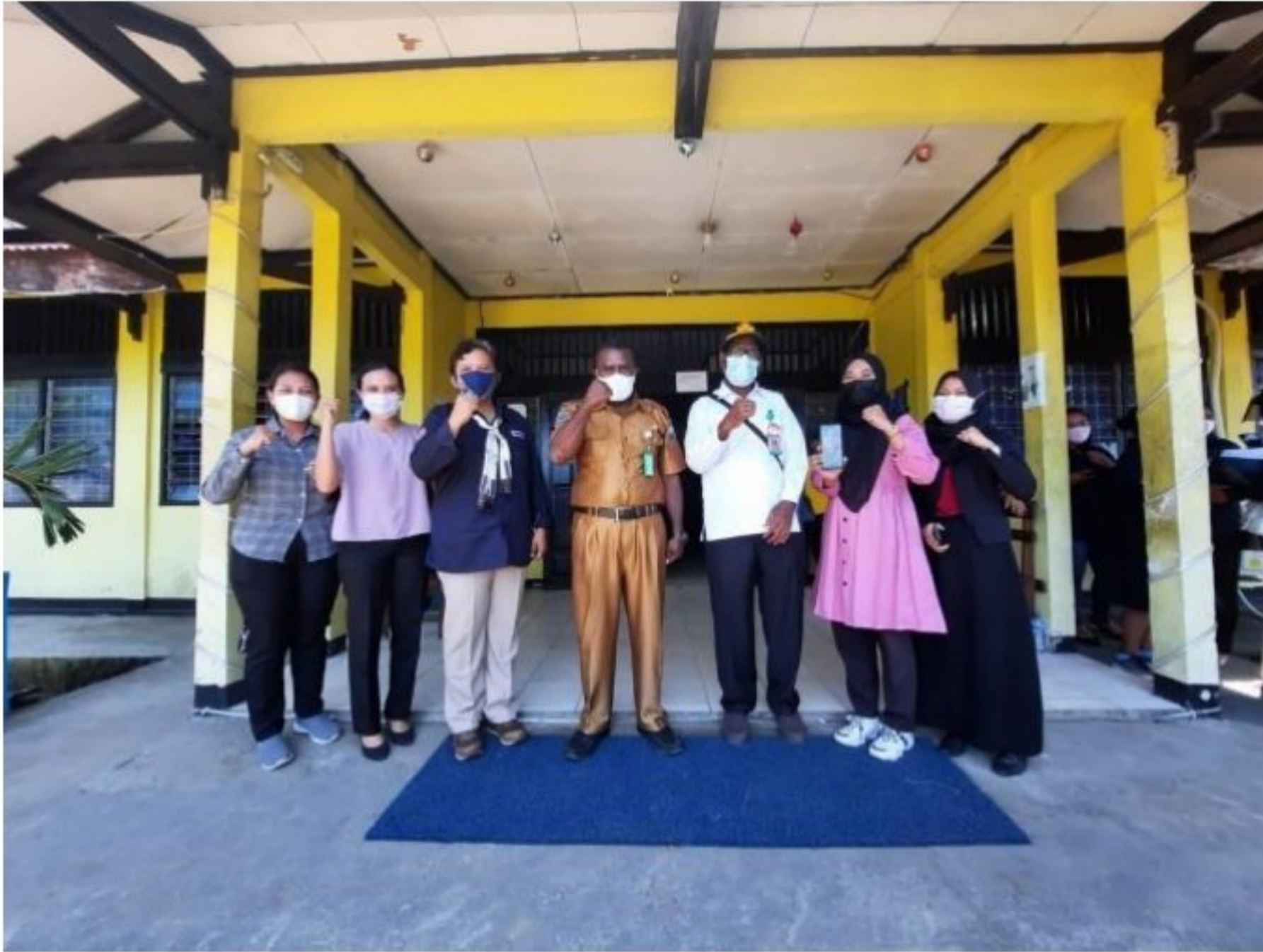
Foto bersama dengan Kadis Kab. Manokwari