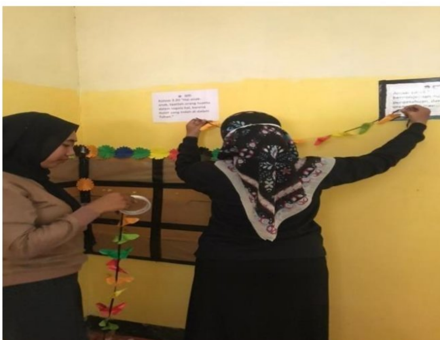
Menempelkan hiasan dinding di perpustakaan mini SD YPK 20 Guweintuy