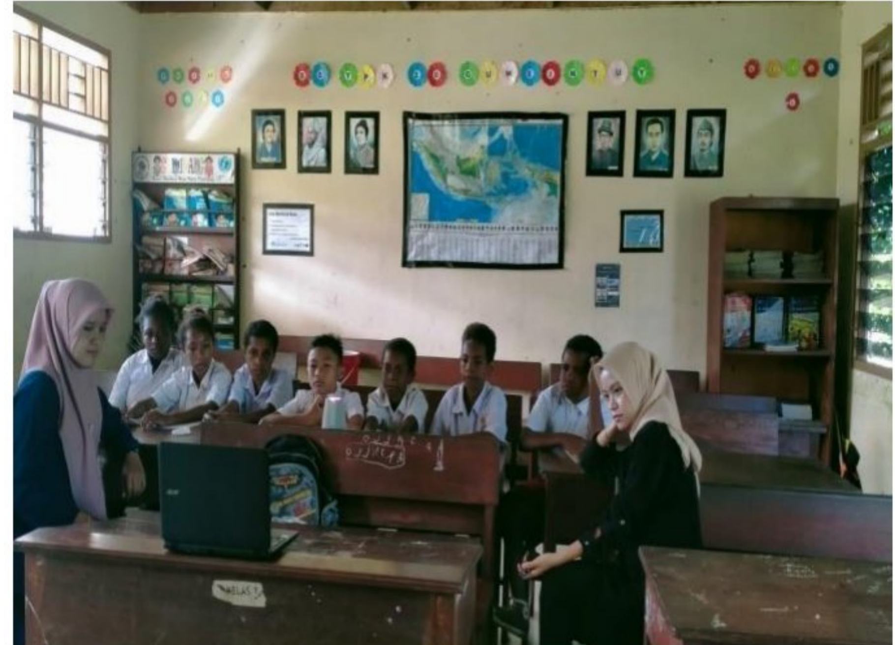
Penampingan pembelajaran peserta didik SD YPK 20 Guweintuy