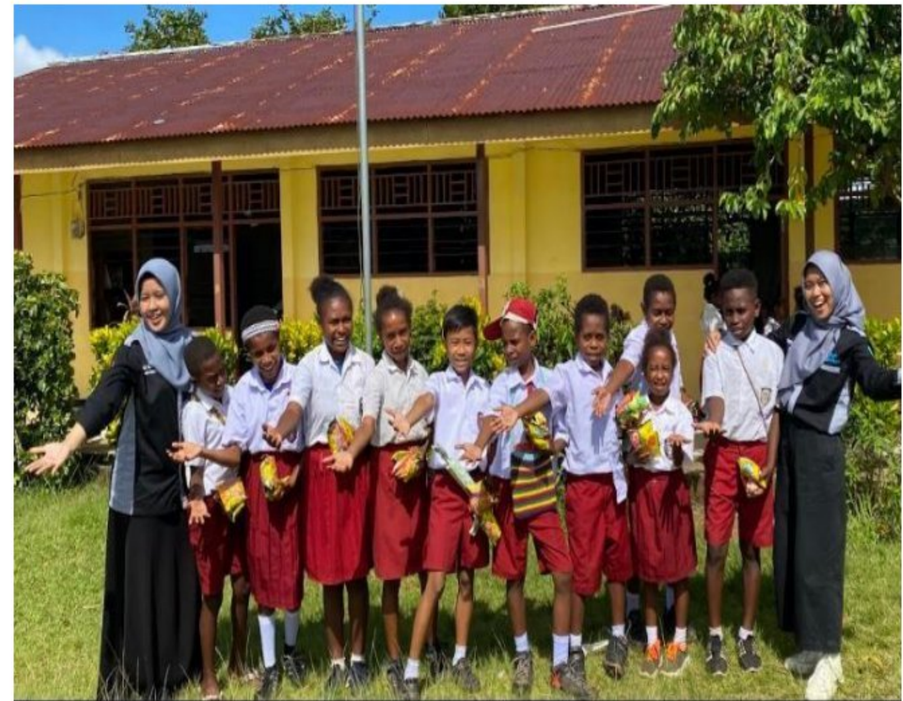
Kegiatan pemberian kenang kenangan kepada peserta didik SD YPK 20 Guweintuy