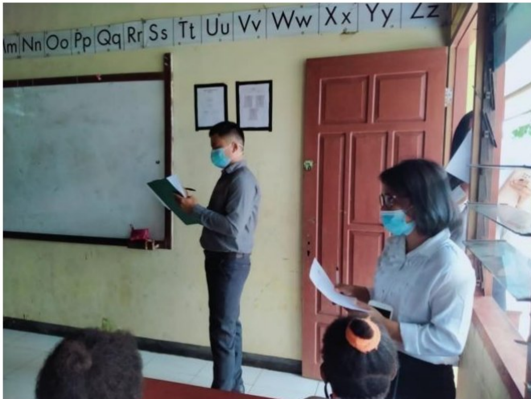
Penilaian kebersihan kelas SD YPK 20 Guweintuy