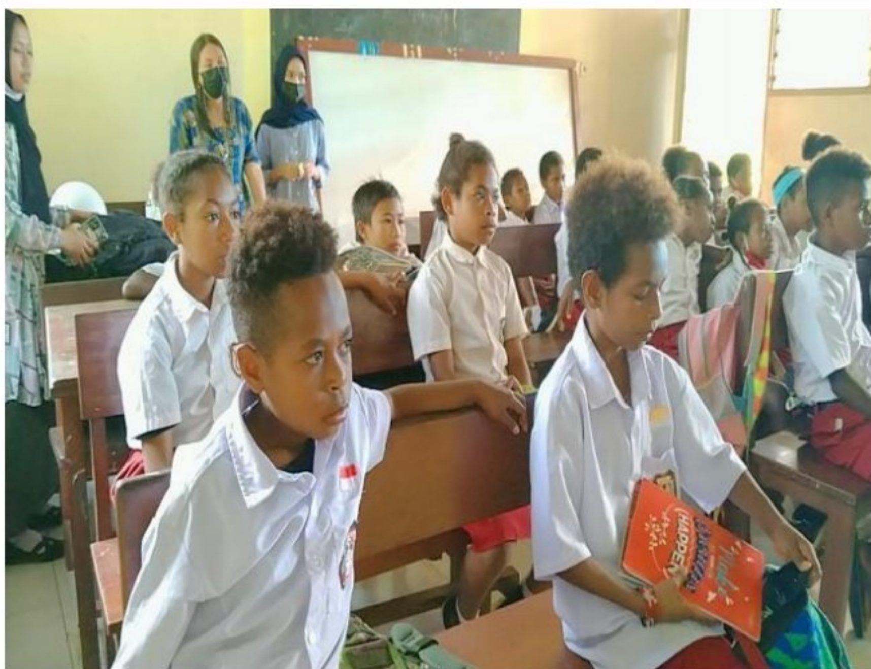
Proses pembelajaran di SD YPK 20 Guweintuy