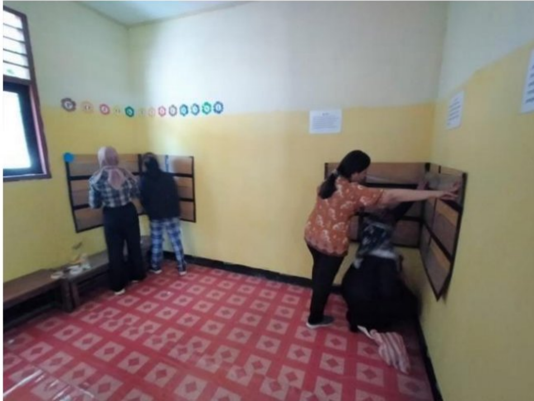
Pembenahan Perpustakaan Mini SD YPK 20 Guweintuy