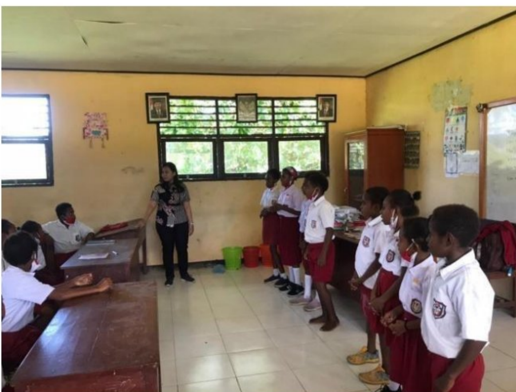
Penampungan pembelajaran peserta didik SD YPK 20 Guweintuy