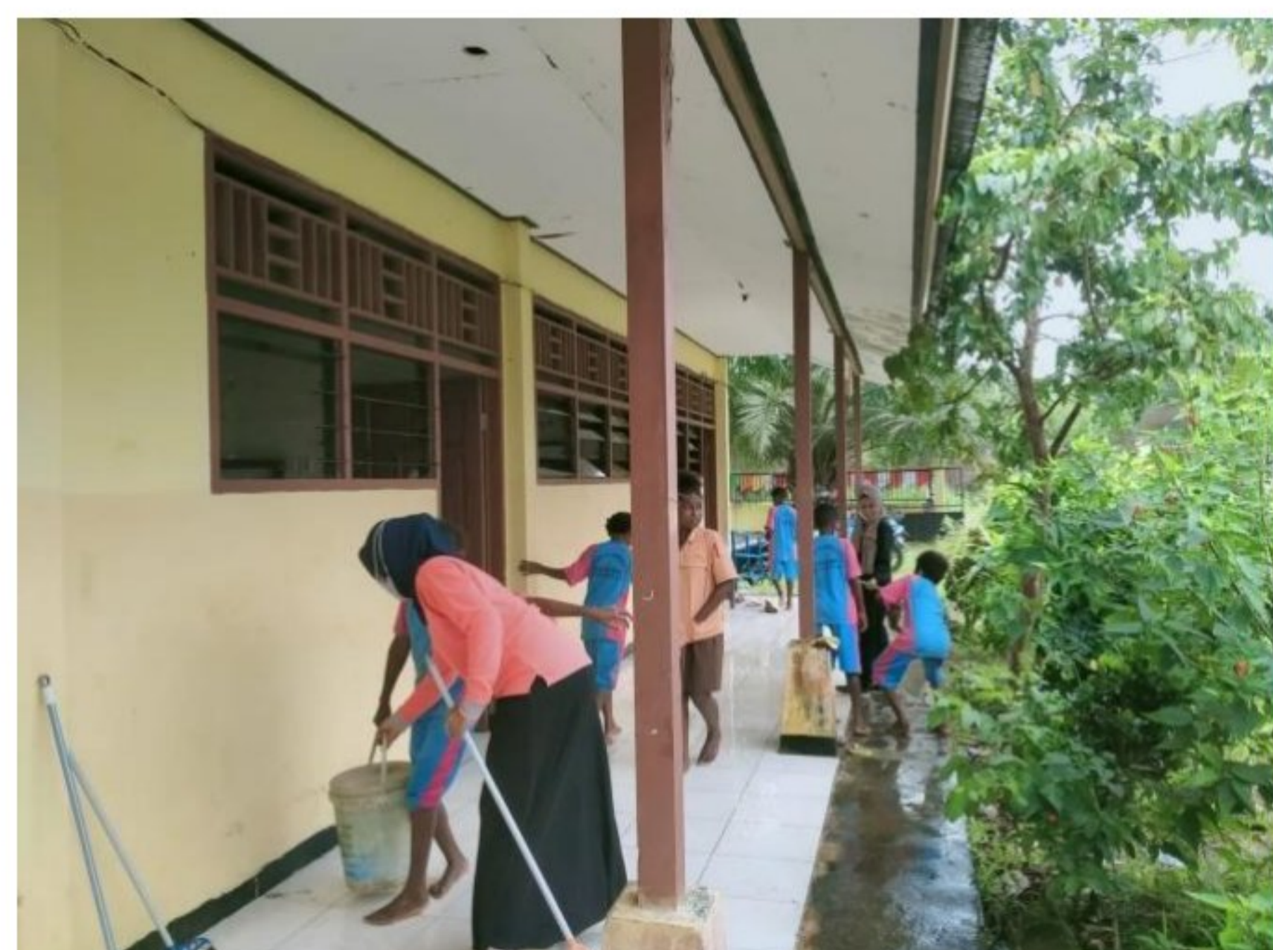
Kegiatan membersihkan di SD YPK 20 Guweintuy