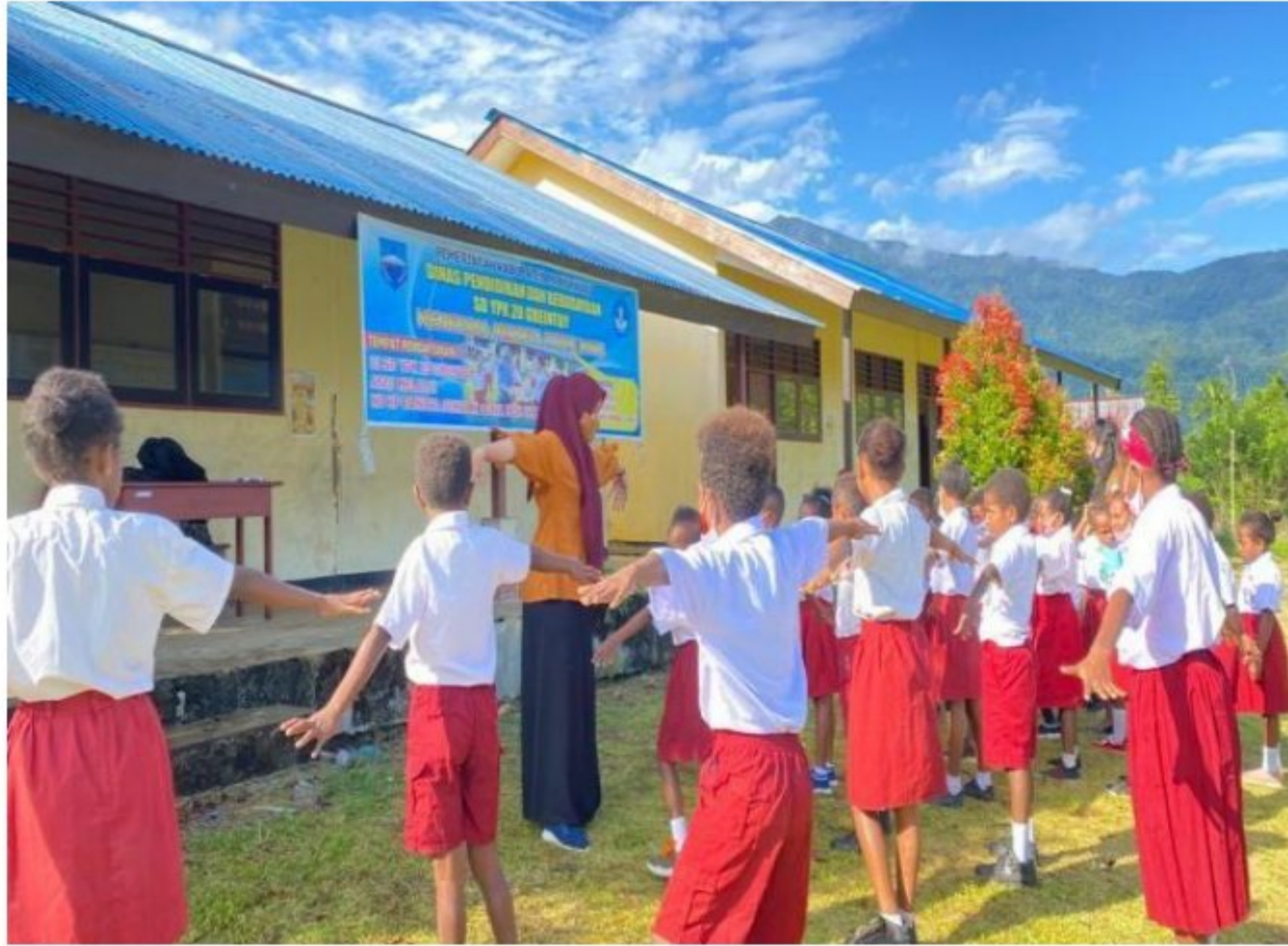
Persiapan apel pagi di lingkungan SD YPK 20 Guweintuy