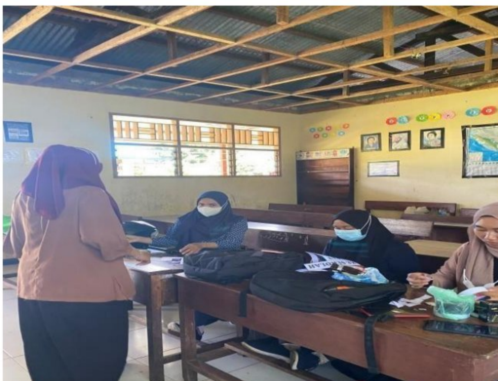
Pembenahan kelas SD YPK 20 Guweintuy