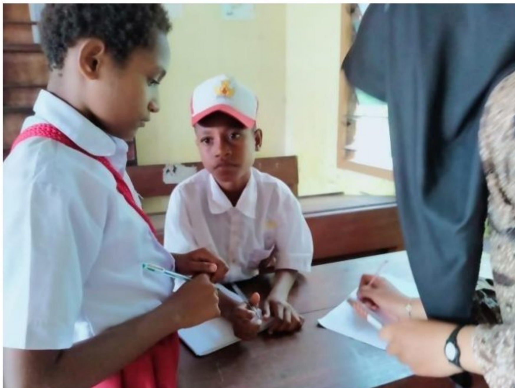
Pendampingan pembelajaran di SD YPK 20 Guweintuy