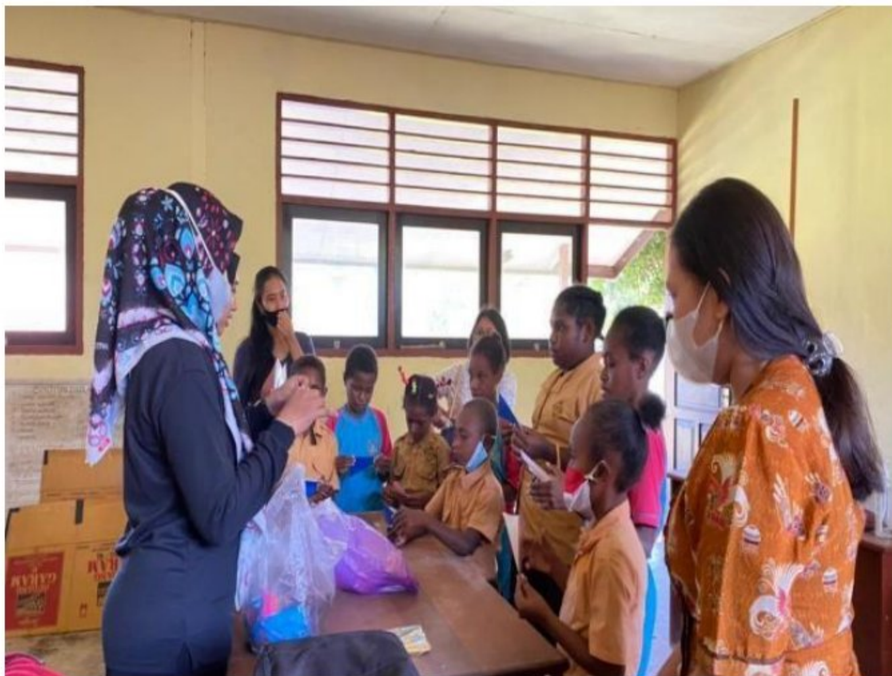
Menghias Perpustakaan Mini bersama peserta didik SD YPK 20 Guweintuy