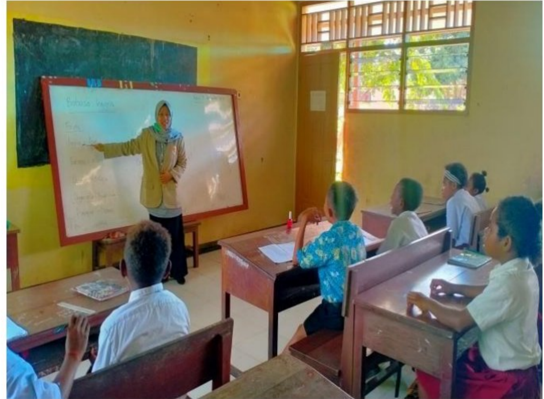
Pendampingan pembelajaran peserta didik SD YPK 20 Guweintuy