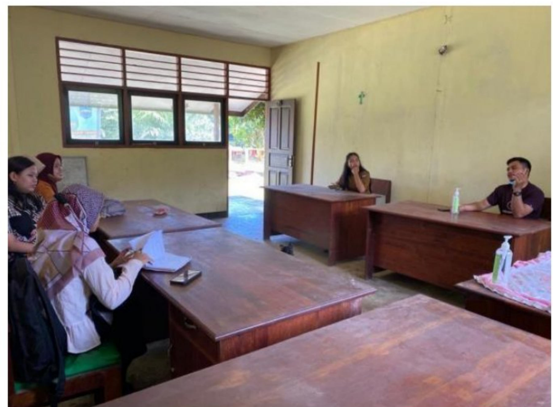
Diskusi pengenalan dengan peserta didik SD YPK 20 Guweintuy