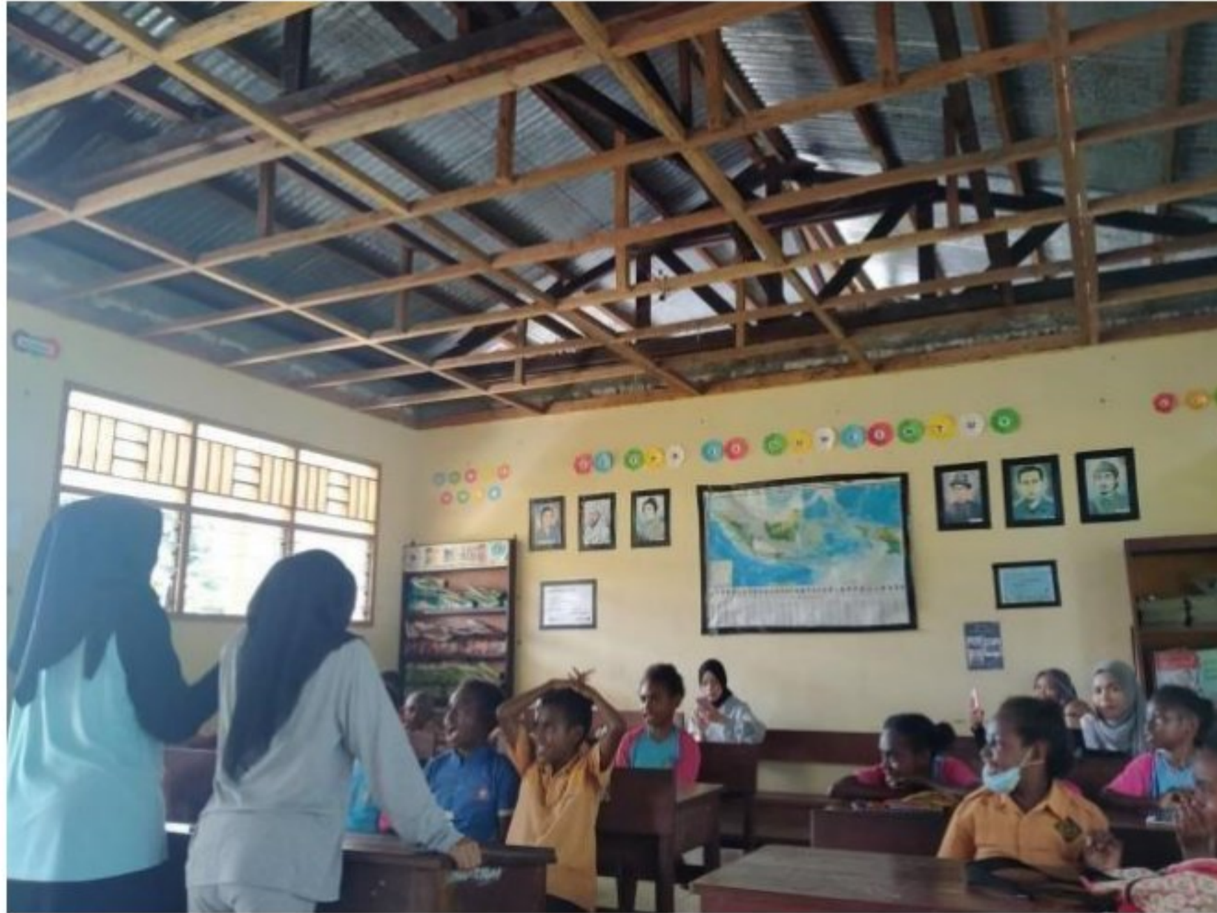
Proses pembelajaran di SD YPK 20 Guweintuy