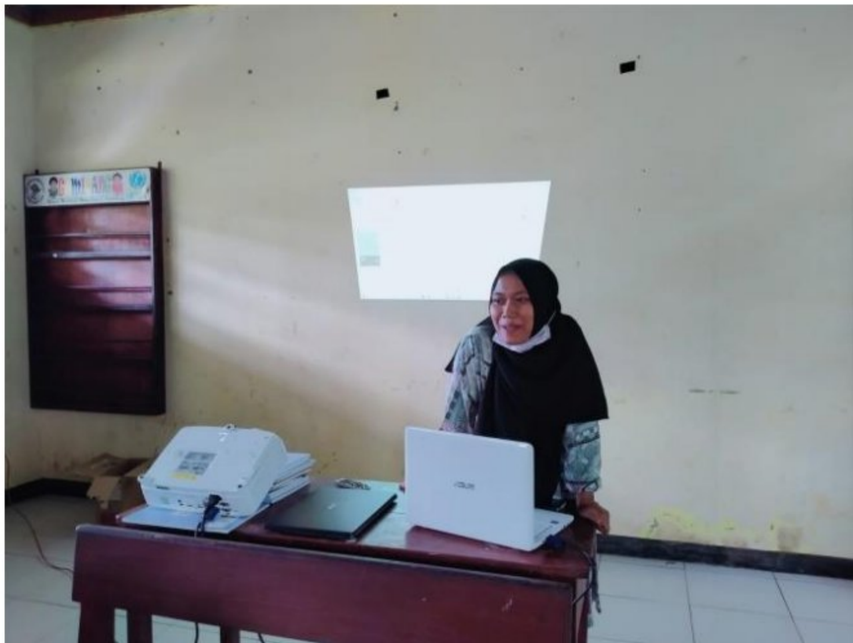
Menampilkan film edukasi di ruangan SD YPK 20 Guweintuy