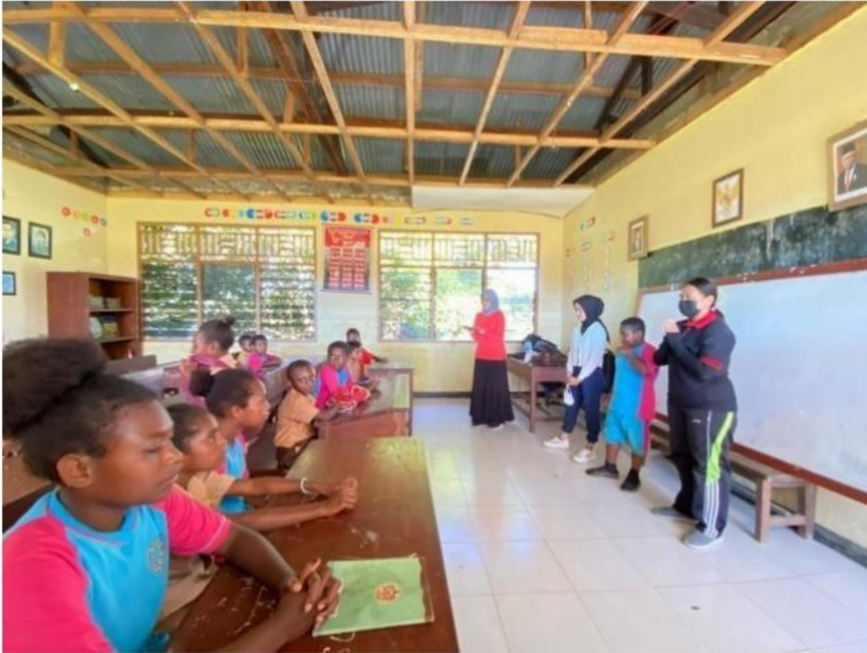
Penerapan nilai religious kepada peserta didik SD YPK 20 Guweintuy