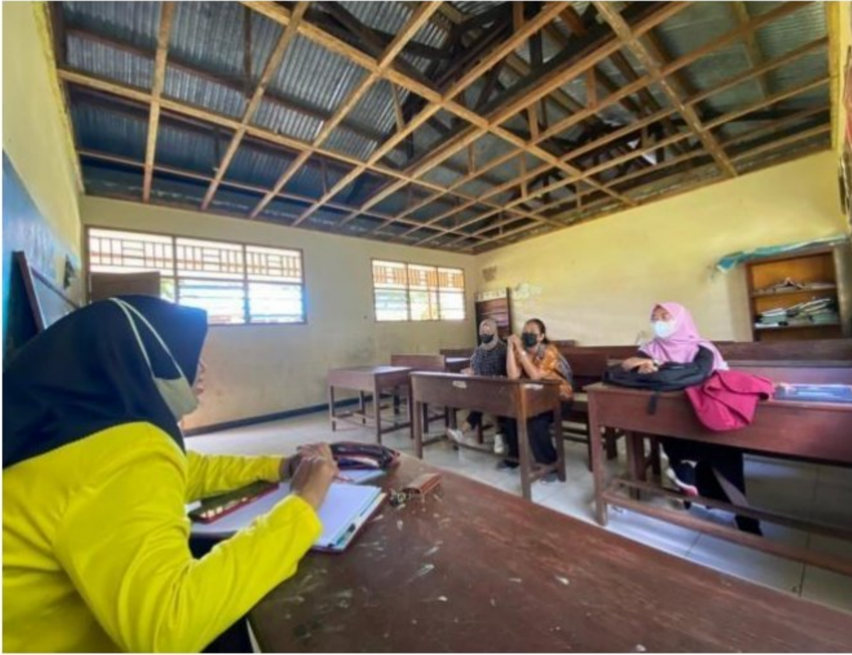
Diskusi bersama tim kampus mengajar angkatan 2 tentang program selanjutnya