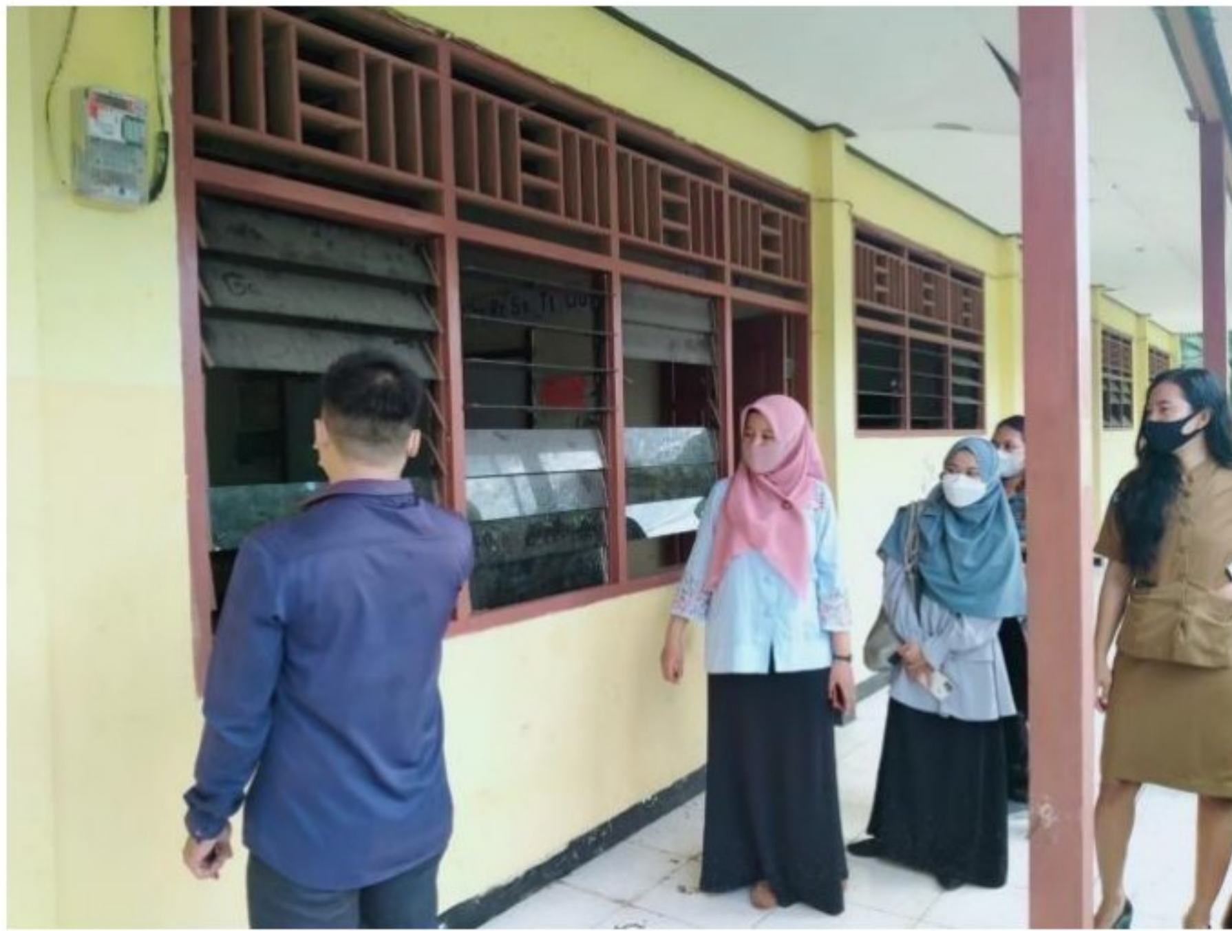
Pengenalan beberapa ruangan di lingkungan SD YPK 20 Guweintuy