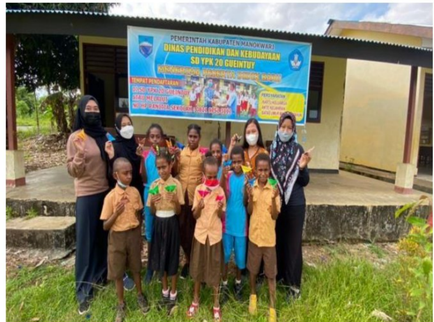
Foto bersama dengan hasil keterampilan hiasan yang dibuat oleh Peserta didik