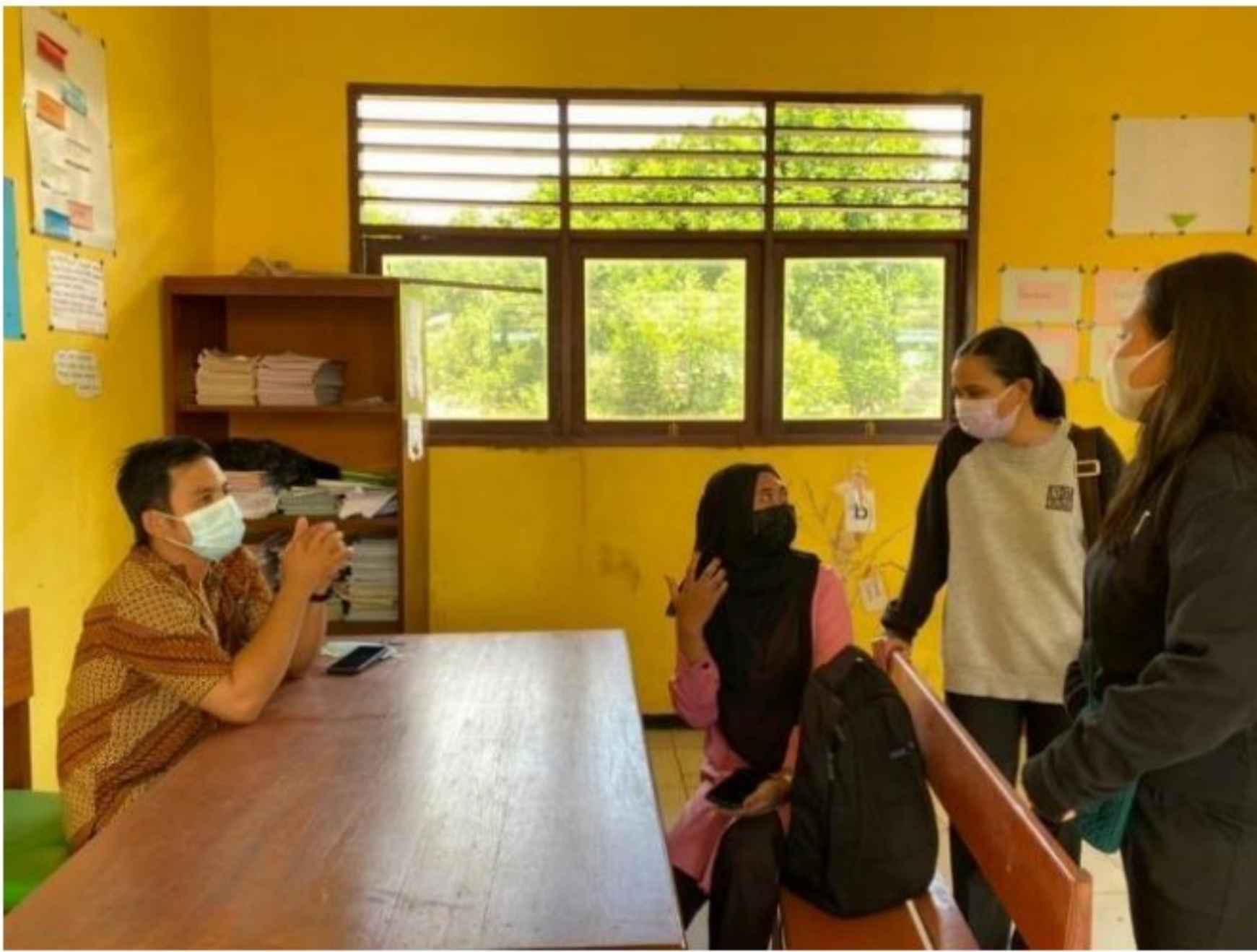
Komunikasi perdana dengan guru SD YPK 20 Guweintuy