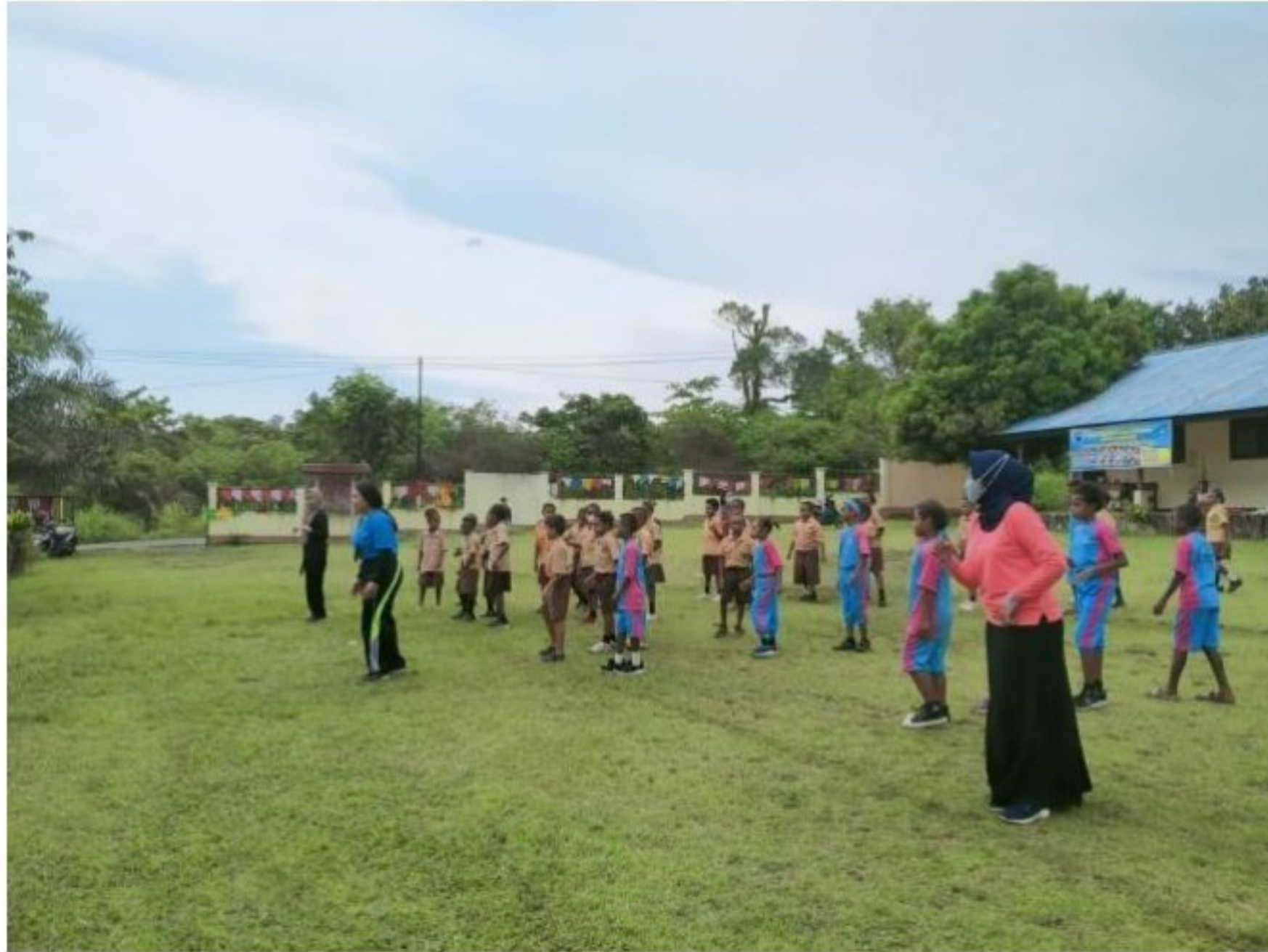
Kegiatan senam bersama di SD YPK 20 Guweintuy