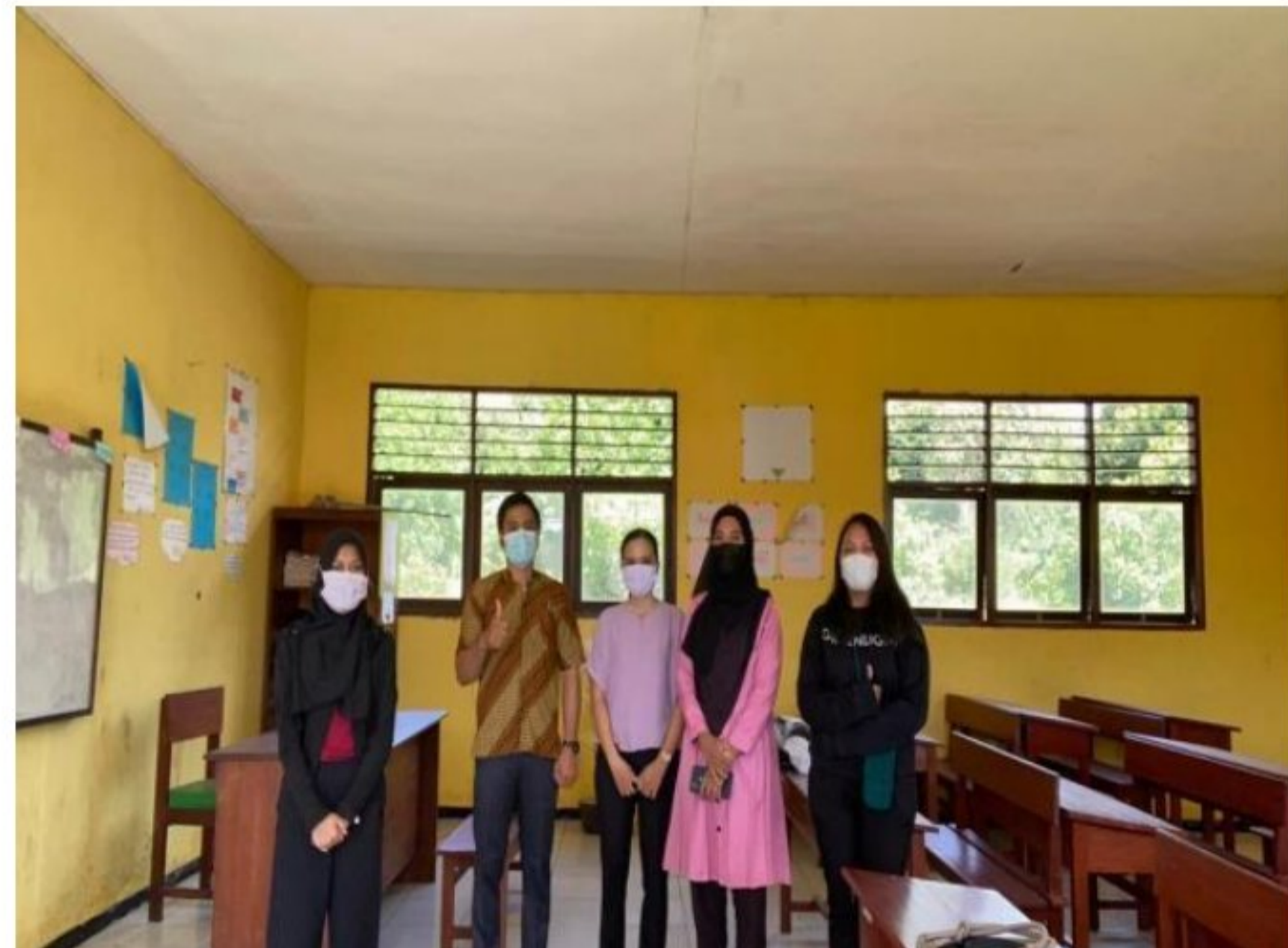
Foto perdana mahasiswa KM 2 dan DPL dengan guru SD YPK 20 Guweintuy