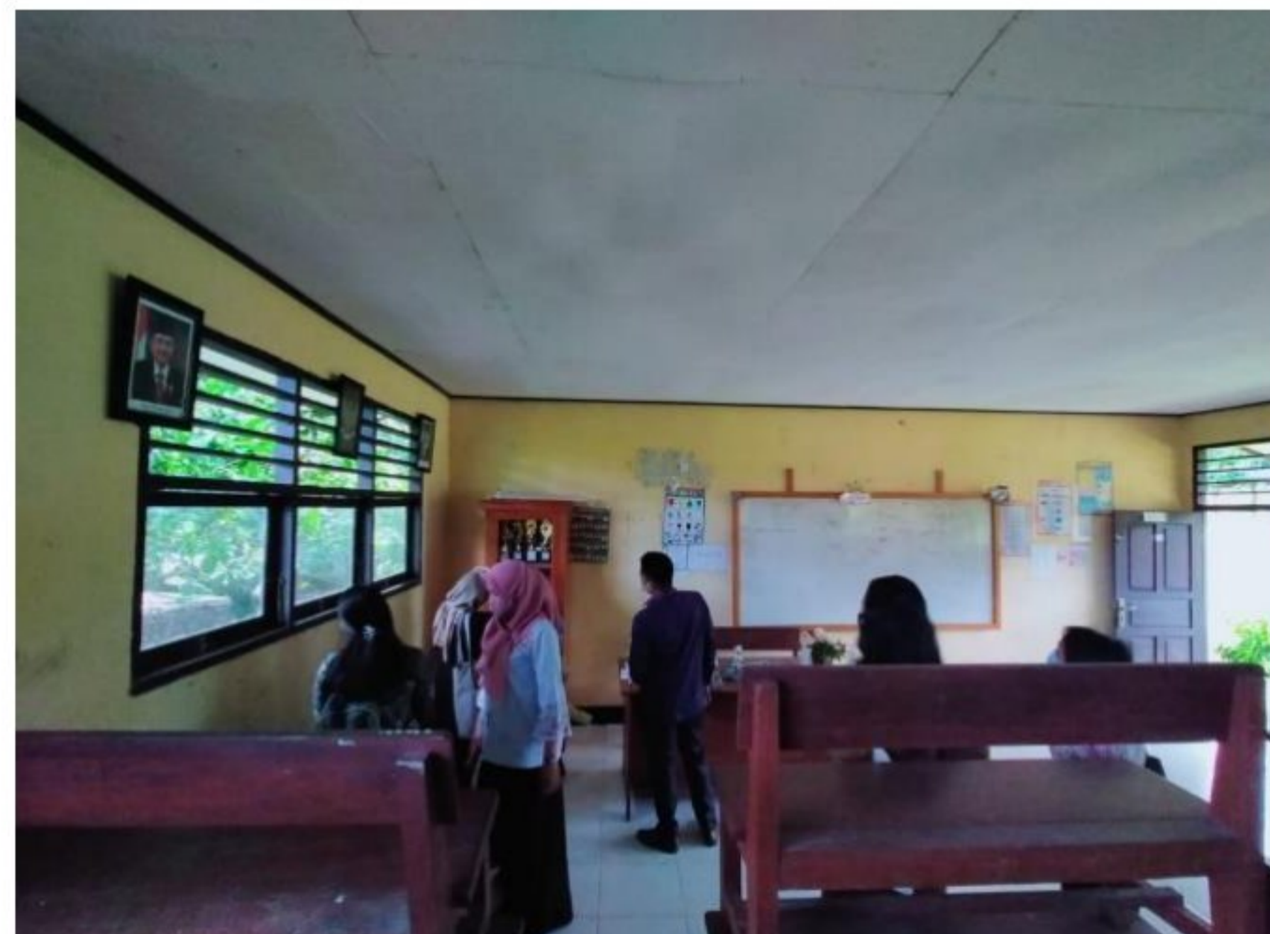
Pengenalan beberapa ruangan di lingkungan SD YPK 20 Guweintuy