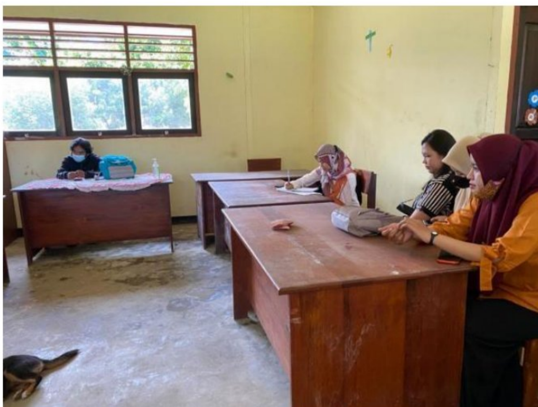
Diskusi pengenalan dengan peserta didik SD YPK 20 Guweintuy