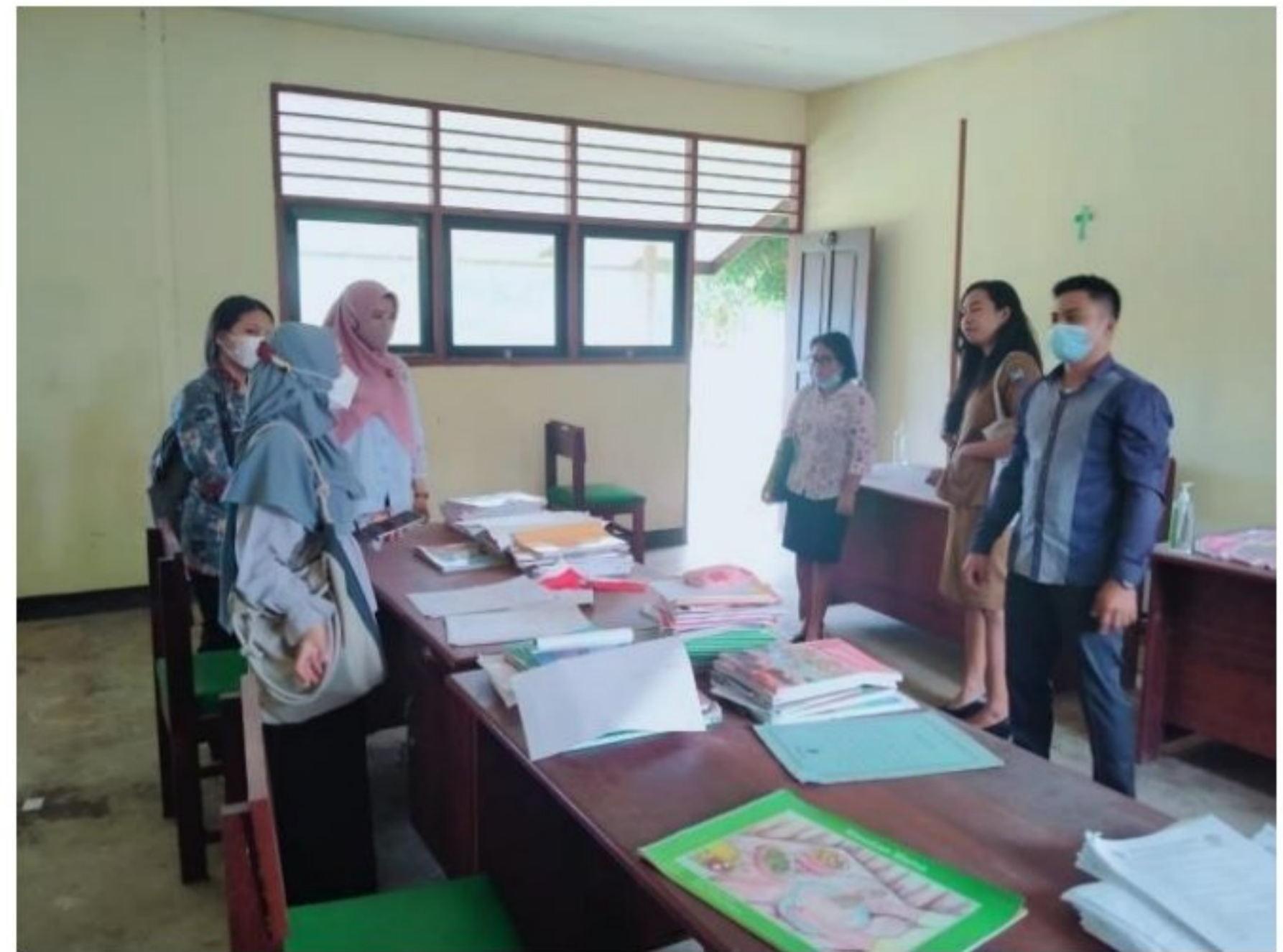
Pengenalan beberapa ruangan di lingkungan SD YPK 20 Guweintuy