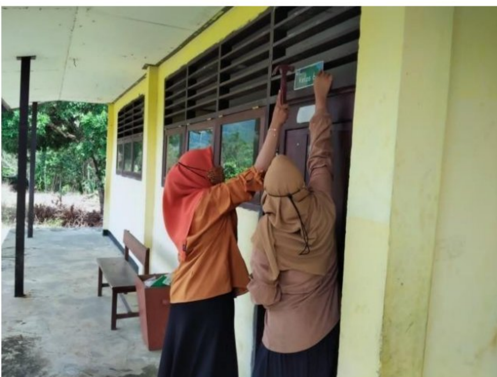
Memberikan identitas kelas SD YPK 20 Guweintuy