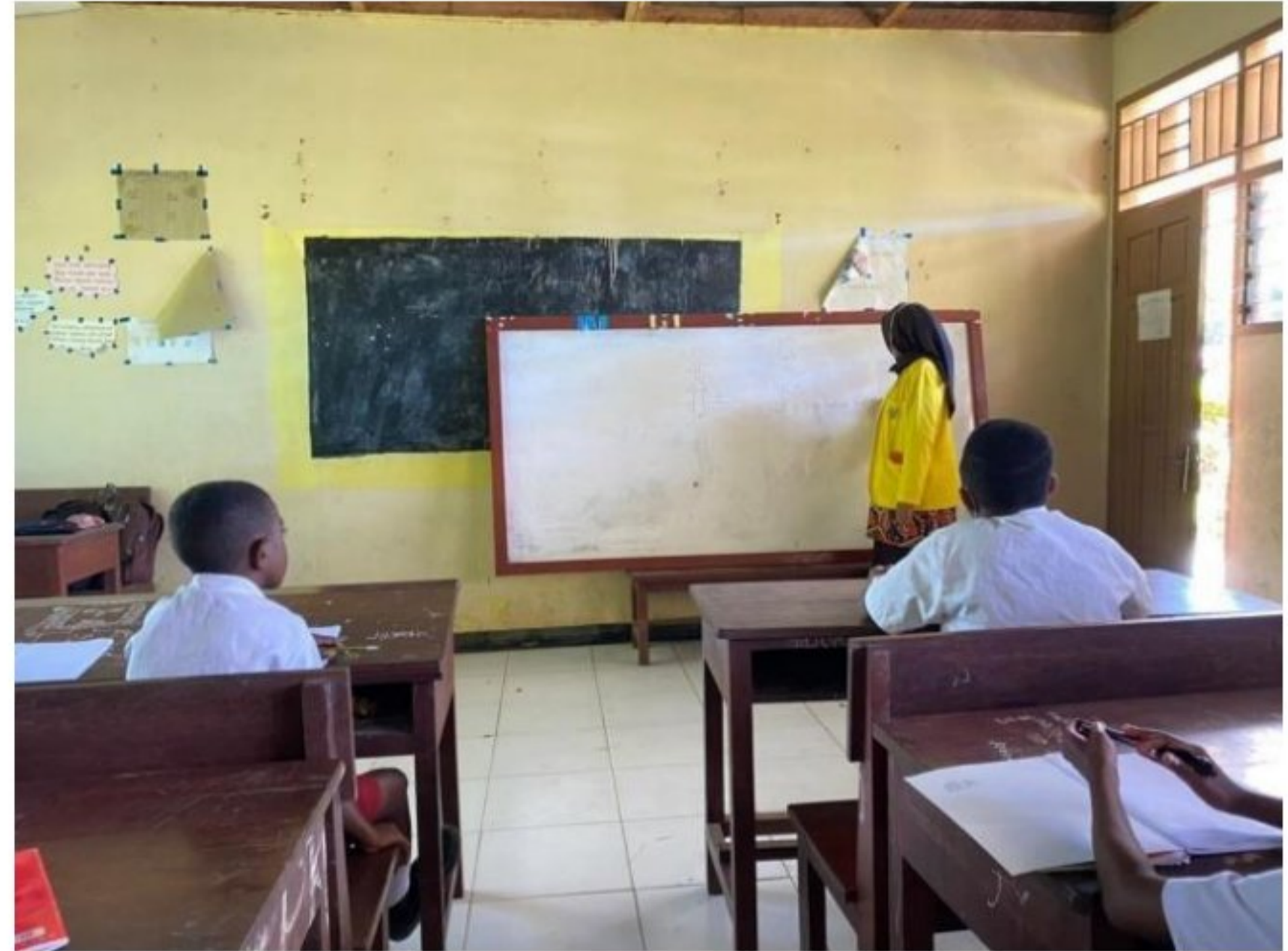
Pemberian kelas tambahan kepada peserta didik SD YPK 20 Guweintuy