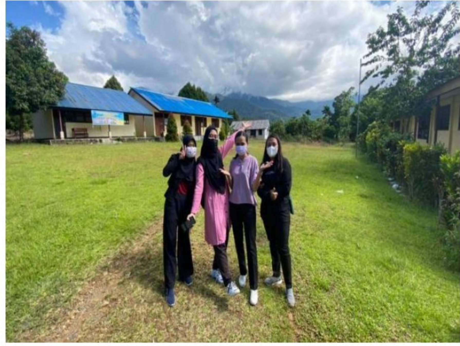
Kunjungan perdana di SD YPK 20 Guweintuy