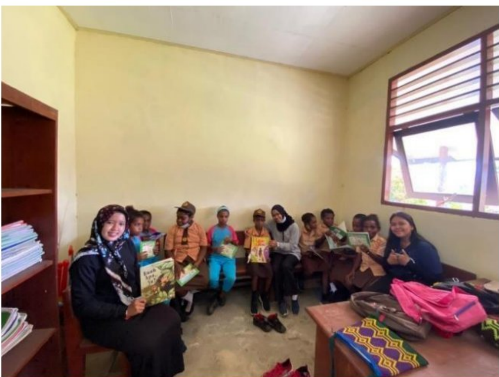
Foto bersama peserta didik di lingkungan perpustakaan mini