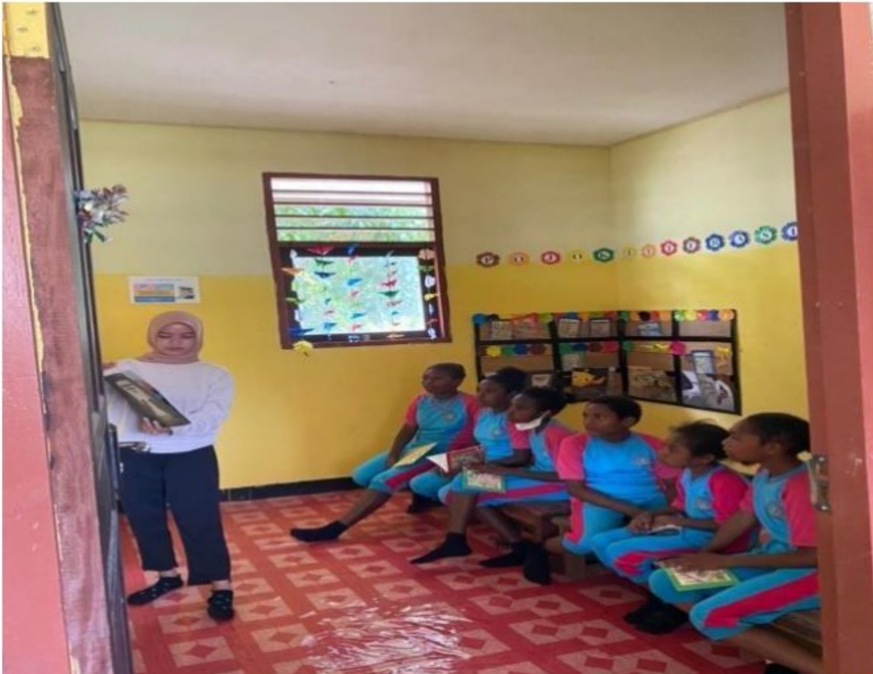
Kunjungan Perpustakaan Mini bersama peserta didik SD YPK 20 Guweintuy