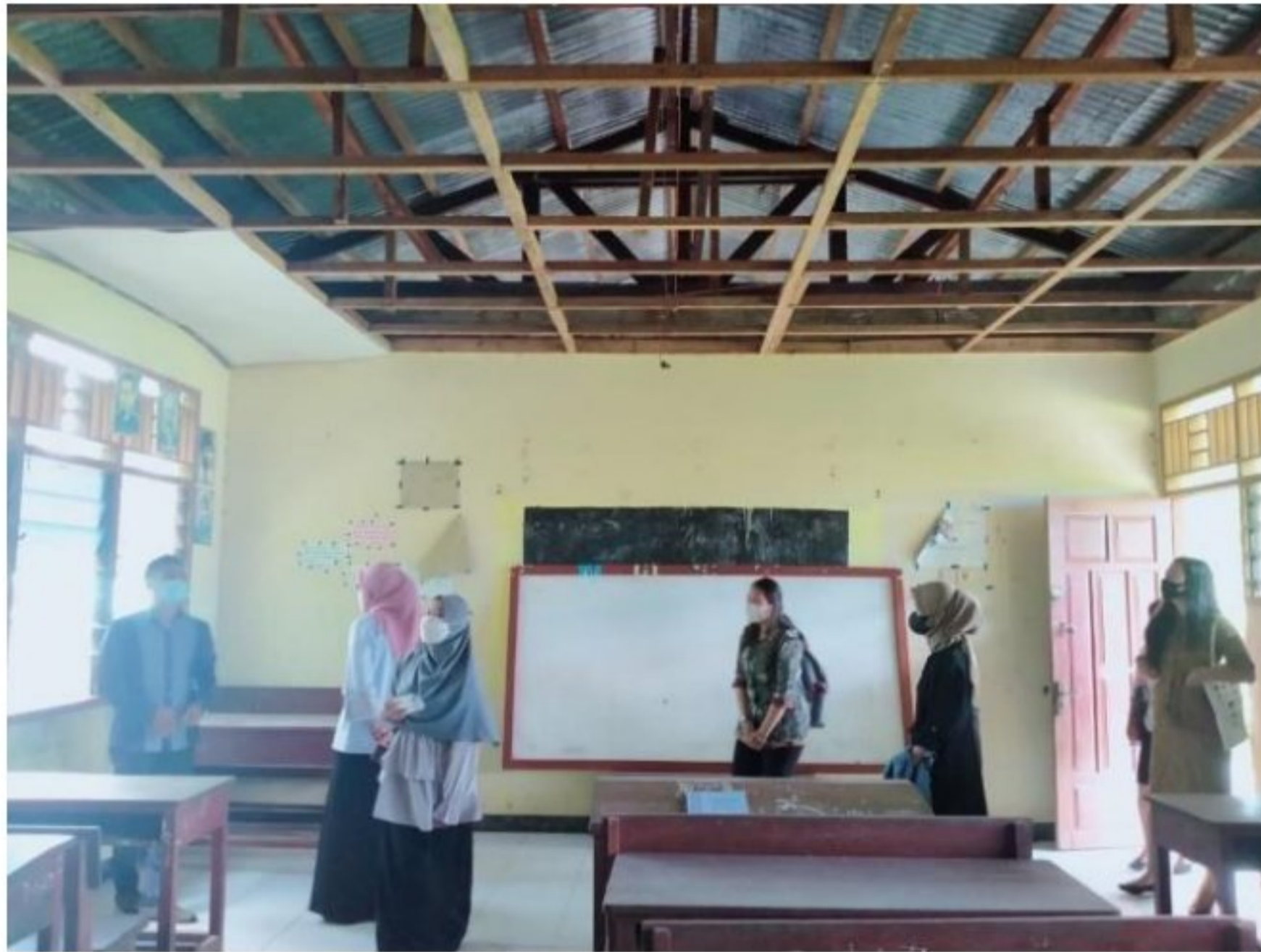
Pengenalan beberapa ruangan di lingkungan SD YPK 20 Guweintuy